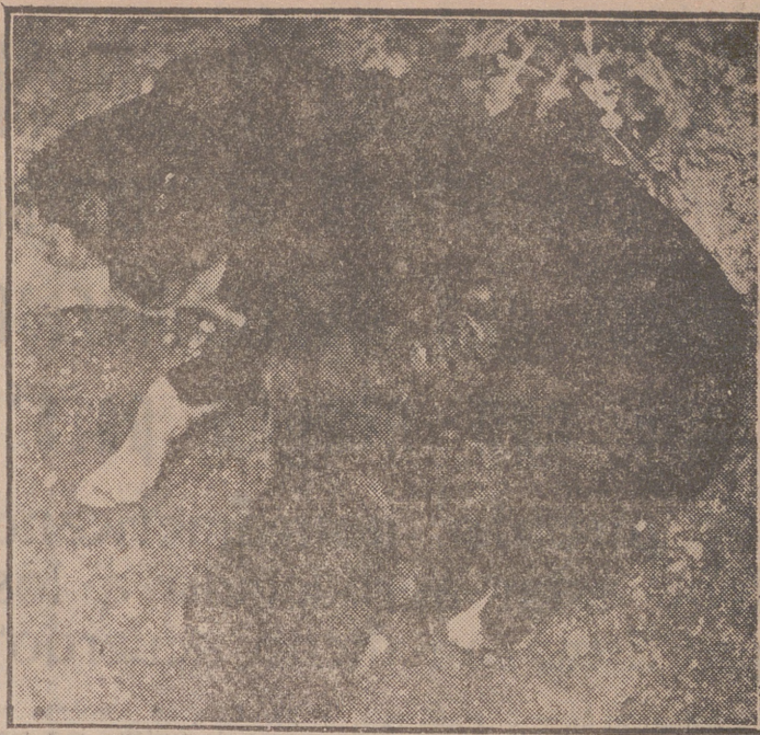
También los perros sufren a veces las consecuencias de los adelantos de la Humanidad. Algunos pueden, sin embargo, atender a su propia descendencia y hasta, como en este caso, a la de una gata que debió de morir dejando ese retortivo que aparece junto al perro hijo compartiendo la mesa.

¿Quiénes son los de la lista? Solución al último jeroglífico: MANDA UN ENLACE