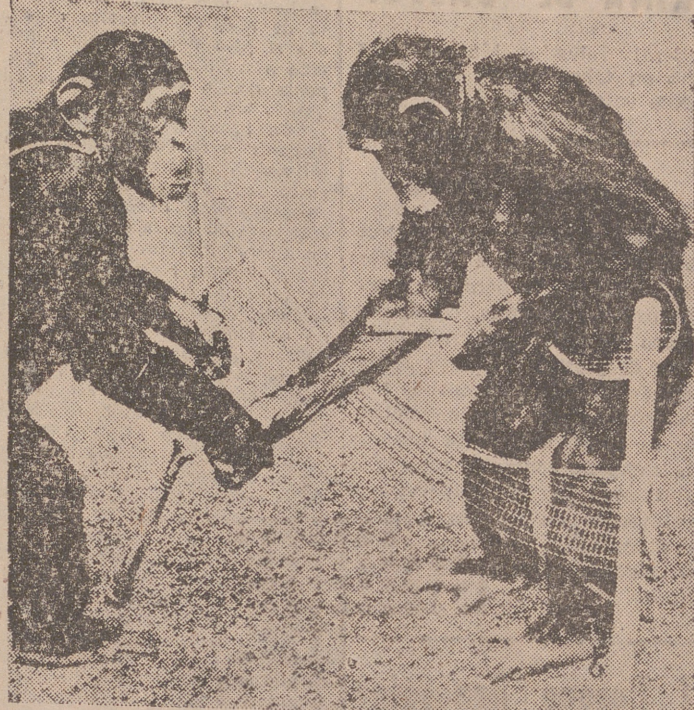
Estos monos han tenido más suerte que otros muchos de sus hermanos, sacrificados en múltiples ocasiones en favor de la ciencia. Por lo menos ellos están, de momento, al margen de cualquier sacrificio, entretenidos en jugar un partido de tenis. Puede que el fatídico turno les llegue cualquier día.

La medicina actual debe sus progresos a los animales cobayas Algunas pruebas podrán parecer terribles, pero nunca estériles