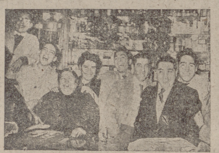
MADRID. — En el sorteo de Navidad han correspondido veintidós millones y medio de pesetas al popular barrio de Legazpi. En la "Droguería de Cortés", se repartieron en participaciones de cinco pesetas tres series del número agraciado con el segundo premio.