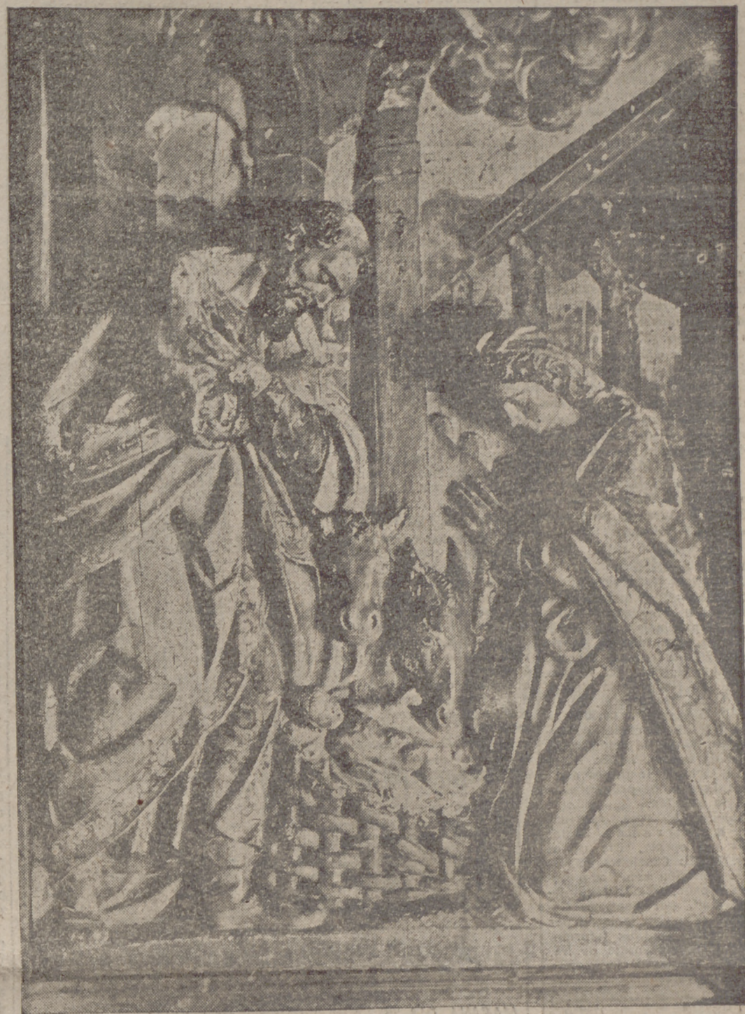
Nacimiento, de Gregorio Fernández, del retablo mayor (1612) de Villarverde de Medina