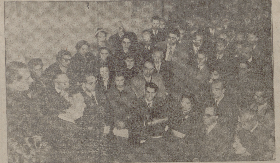
MADRID.—El Ministro Secretario General del Movimiento recibe a los miembros de la Asamblea Nacional de Profesores, Adjuntos y Ayudantes de los Institutos Nacionales de Enseñanza Media...