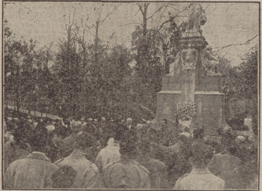
Con motivo de la Semana dedicada a Cuba, el político cubano Orestes Ferrara, con la colonia, y de los estudiantes que cursan sus estudios en Madrid, depositan una corona de flores ante el monumento a Cuba que se levanta en el Retiro.

Ayer se empezó a discutir el problema de Alemania