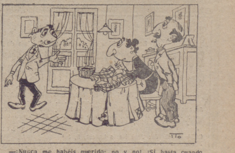
—¡Nunca me habéis querido; no y no! ¡Si hasta cuando nací me pusisteis de nombre Jeremundo...!