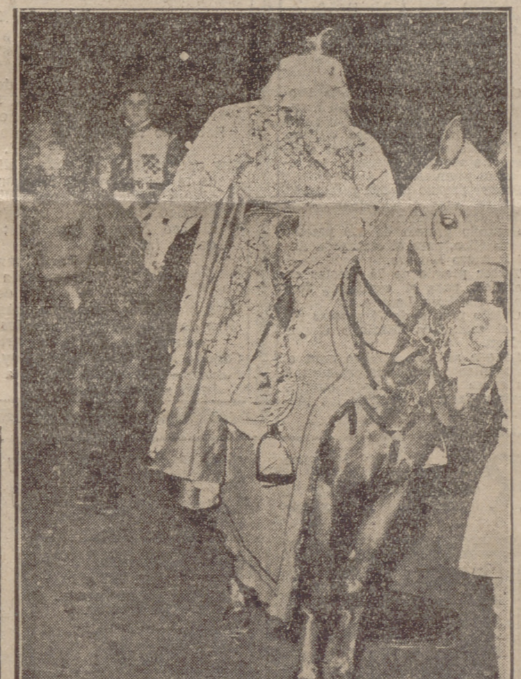
Ayer, los Reyes Magos llegaron a Valladolid, y recorrieron sus calles principales, con la tradicional y fastuosa Cabalgata que el Frente de Juventudes viene organizando ya hace muchos años. Miles de pequeños y mayores admiraron el maravilloso cortejo, a pesar de lo desahogado de la noche. Y los Magos dejaron su regala carga de juguetes e ilusiones que hoy alegrarán la vida de tantos y tantos niños. (MÁS INFORMACIÓN, EN PAGINA INTERIOR.)