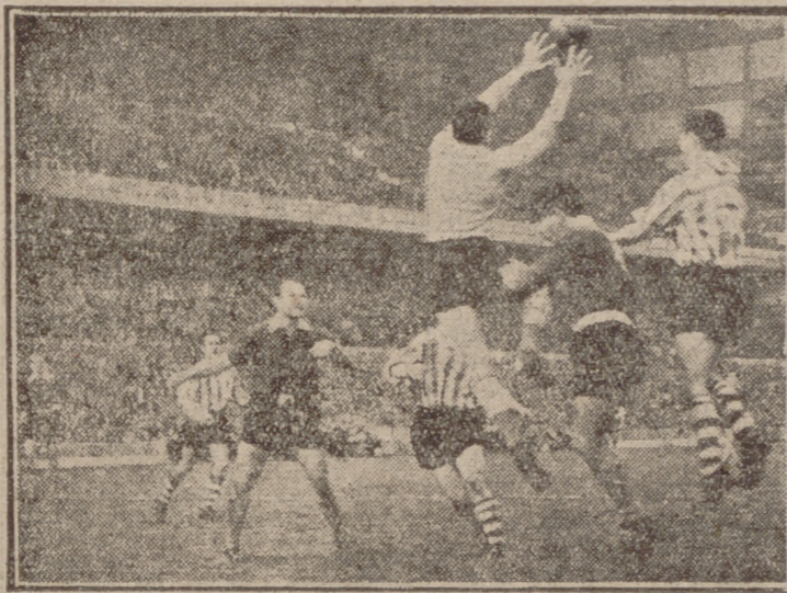
ELBAJO.—En San Mamés se jugó un partido entre el Independiente y el Atlético, que terminó con el resultado de 5-2 a favor de este último. Los atléticos atacan con nervio la meta argentina.