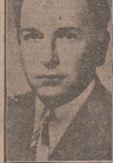
DOCTOR JOSÉ RICARDO MARTÍNEZ COBOS, ministro de Educación de la República del Ecuador, que representa a su país en la Asamblea de Universidades Hispánicas