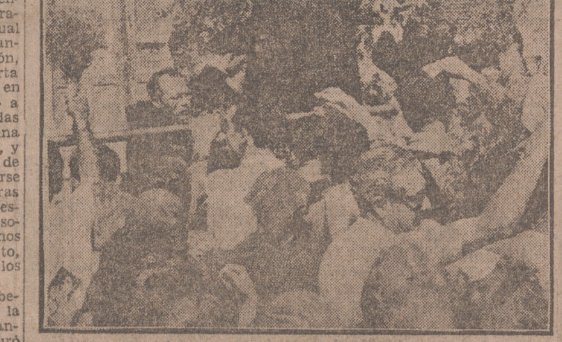
En una calle de Siracusa, capital de la isla de Sicilia, está, en una humilde hornacina, la Virgen de las Lágrimas, la Virgen que llora y que, según las gentes, hace milagros. Millares de personas acuden ante esta Virgen. Las autoridades eclesiásticas aún no han dado su opinión. Pero los médicos que analizaron las lágrimas, encontraron que su composición química era igual a las de las lágrimas humanas.