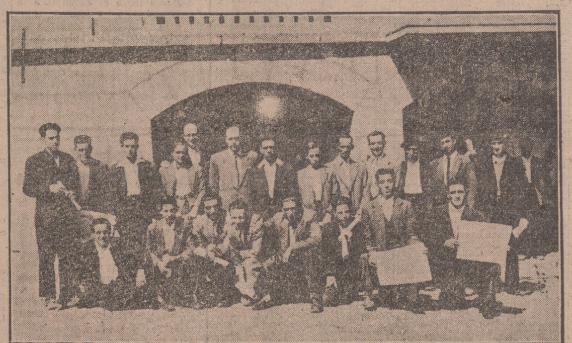
Profesores y alumnos a la salida del Ayuntamiento, después del clausura.