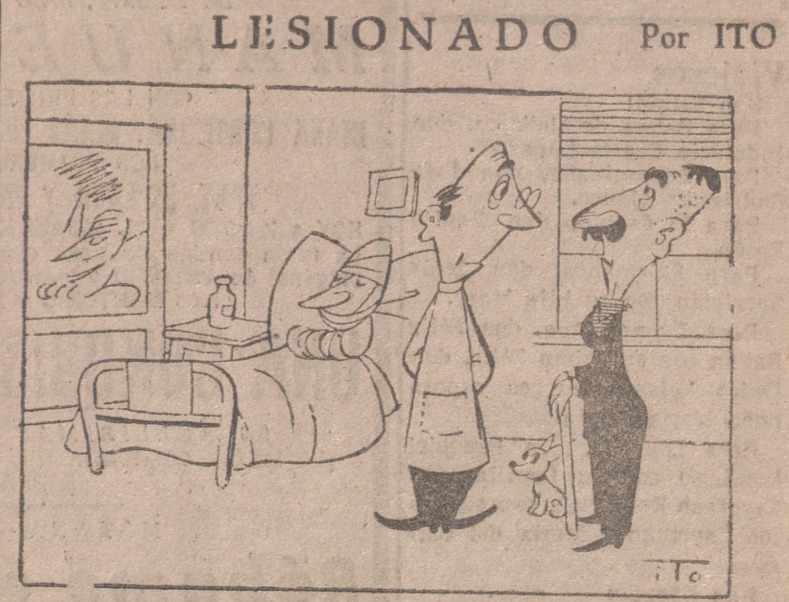
—Lo que más siente es la rotura de algunos tejidos. —Claro; como que es un fabricante de paños de Tarrasa.