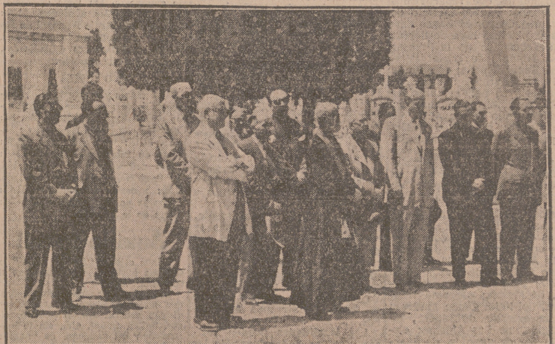
Jerarquías falangistas y autoridades ante el mausoleo de Onésimo, donde se depositó una corona de laurel.