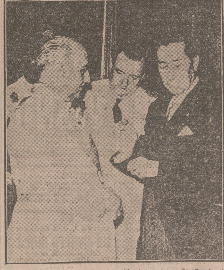
En el Palacio de El Pardo le ha sido impuesta a Su Excelencia el Jefe del Estado la Gran Cruz del Mérito Civil, que recientemente le fué concedida por el presidente de la fraterna República del Ecuador. Asistieron al acto el embajador de aquel país, el ministro de Asuntos Exteriores y altos jefes de las Casas Reales.