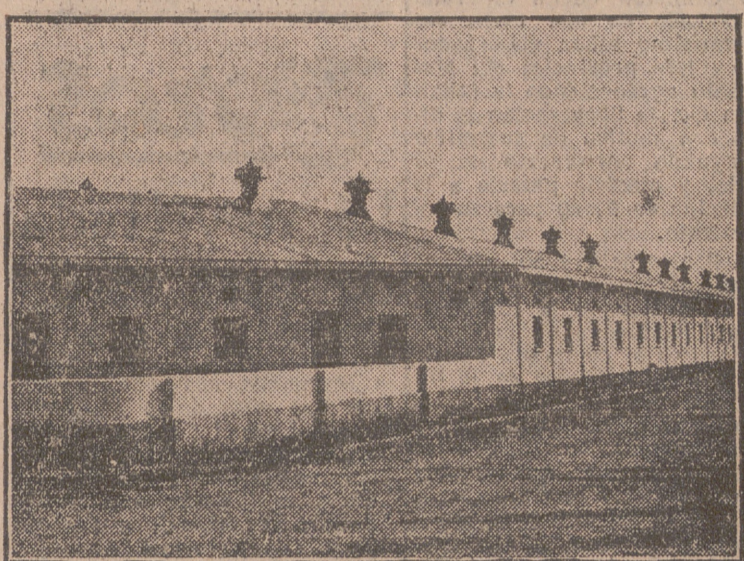
En este reportaje gráfico de Gullón pueden verse otros tres aspectos de las magníficas instalaciones de la Granja Florencia.