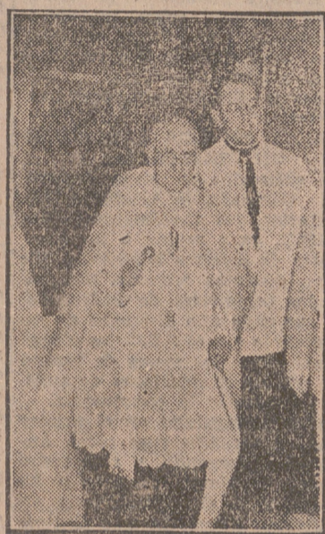
El Vicario Capitular bendiciendo el edificio.

El piso principal, al que se accede por amplia escalinata por la fachada anterior hasta el vestíbulo de reparto y recepción; a ambas manos se hallan la Dirección, Administración, salas de conferencias y juntas, biblioteca y capilla. En segundo término está destinada esta planta, al centro, para laboratorios, farmacia y prepa-