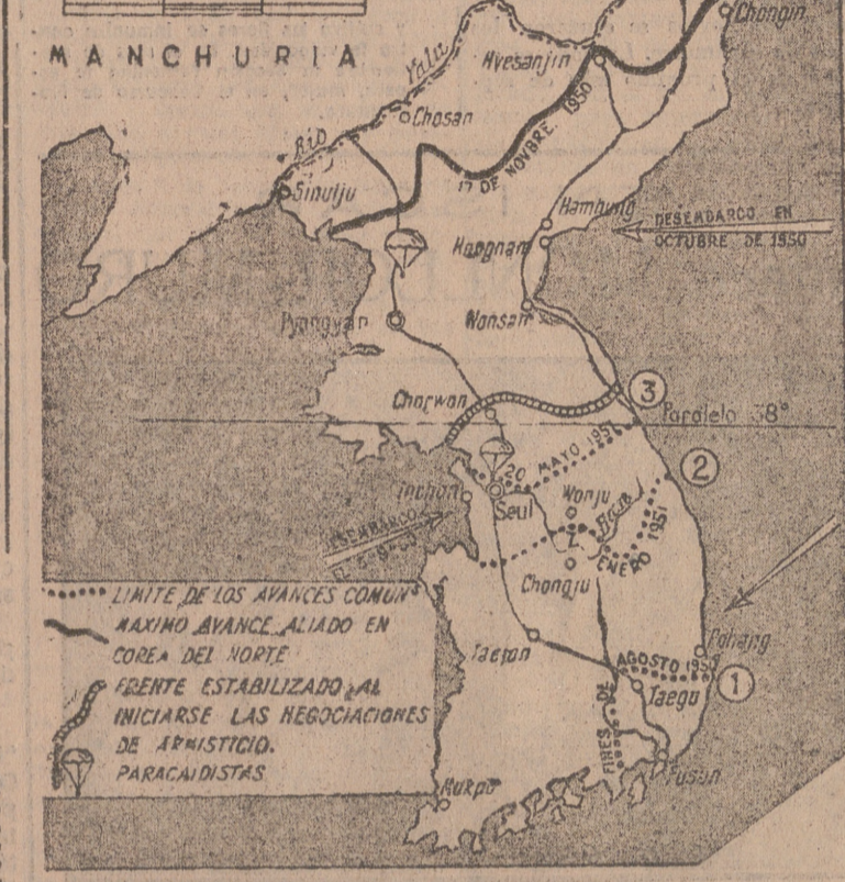
En agosto de 1950 las fuerzas comunistas llegaron a dejar reducida la zona de las Naciones Unidas al sector de Fusán, en el sur de la península. Tres meses después los aliados reconquistaron el país y alcanzaron las inmediaciones de la frontera con Manchuria. En la actualidad, el frente se encuentra, más o menos, a la altura del paralelo 38, donde comenzó la agresión hace tres años.