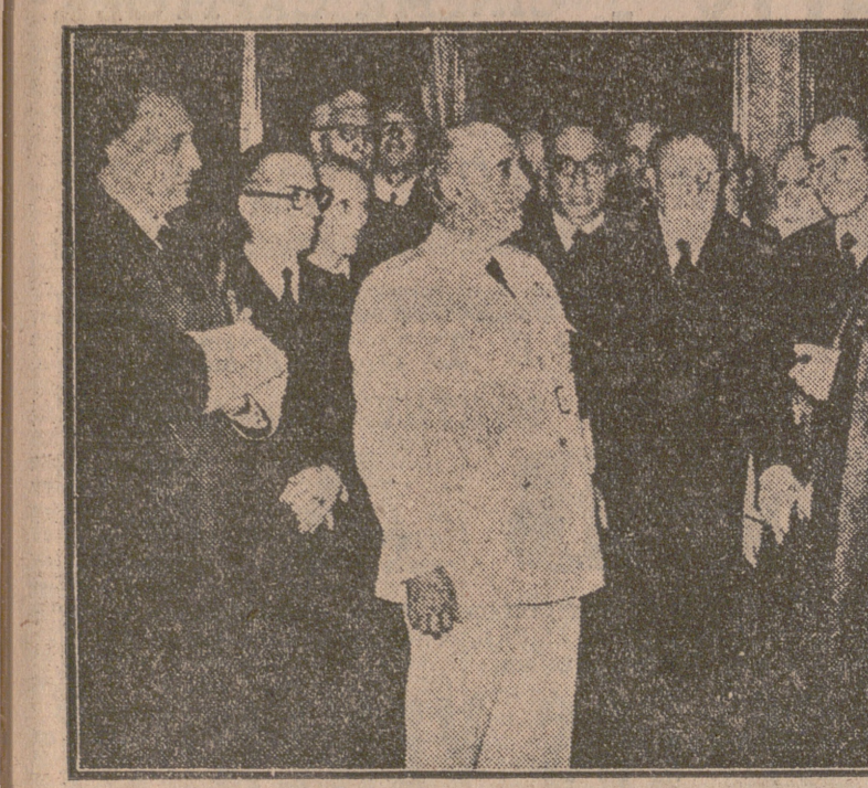
Los presidentes de los Colegios de Abogados de España han celebrado una Asamblea en Madrid. Fueron recibidos, acompañados por el ministro de Justicia, por S. E. el Jefe del Estado, momento que recoge nuestra fotografía.