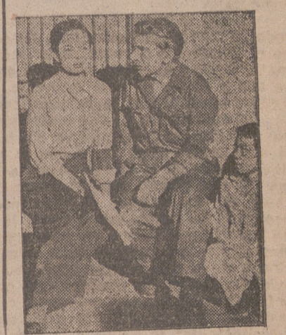
HOY estrena el Gran Teatro Calderón una película que ha recibido el elogio de cuantos países la han contemplado. El heroísmo de los primeros combatientes sobre la península de Corea y la obediencia y los sacrificios de las pocas mujeres que se acompañaron, cobran en esta soberbia realización de Radio Films toda su grandeza. Hemos de resaltar el estupendo reparto, a cuya cabeza destaca la bellísima ANN BLYTH y el nuevo galán ROBERT MITCHEUM, que logran una interpretación insuperable.

"COREA, HORA CERO...!" es, sin duda, una de las más apasionantes películas de acción filmadas en los últimos años.