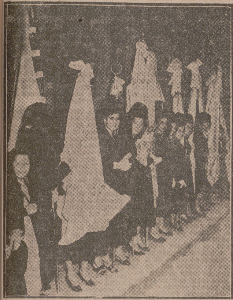
Grupo de banderas de Acción Católica con sus madrinatas.

Solemne pontifical, procesión y bendición eucarística en las inmediaciones del Santuario Nacional