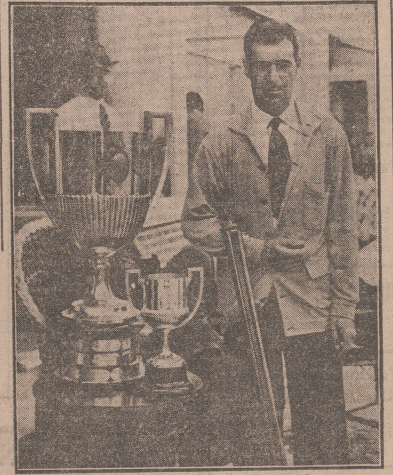
Una reciente fotografía del tirador español conde de Teba, que en Vichy ha ganado el Campeonato del Mundo de Tiro de Pichón con treinta y cuatro pájaros de treinta y cinco.