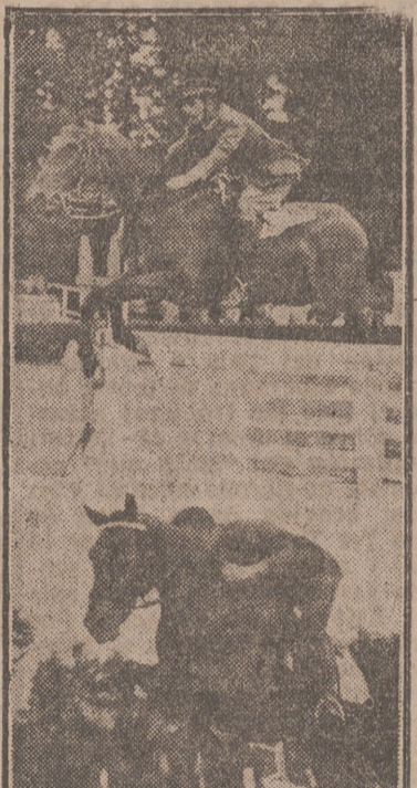
Los interesantes saltos correspondientes a la prueba de ayer.

Se corrió la prueba "Ejército del Aire", para toda clase de caballos, y en ella participaron la mayoría de los inscritos en el Concurso, con la ausencia lamentable de Goyoaga con sus magníficos caballos, porque el internacional civil tuvo que mar-