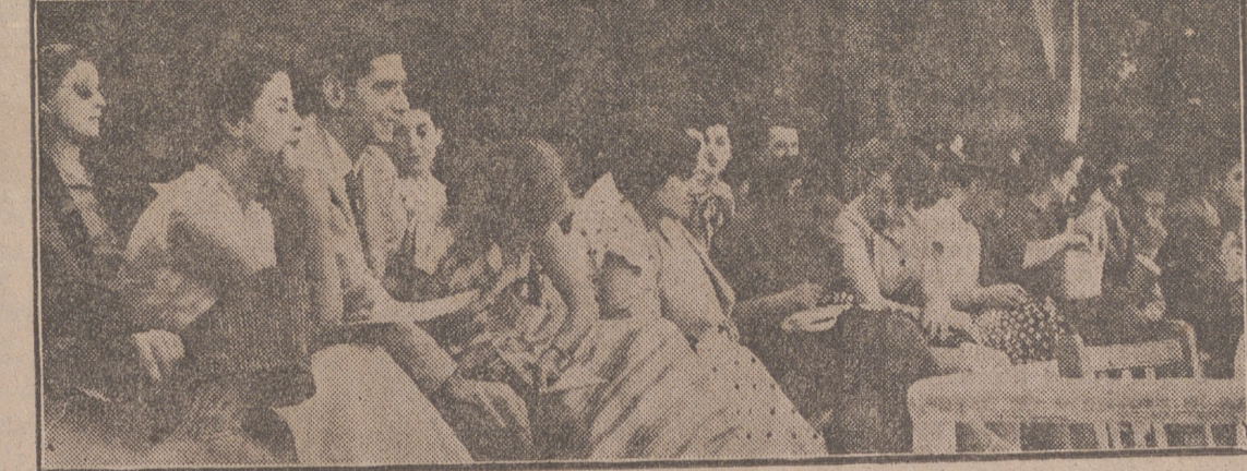
Las señoras y señoritas vallisoletanas representan un importante contingente de la afición hípica de nuestra ciudad. Aquí ha captado Carvajal a un grupo de bellas locales interesadas en la prueba y en las apuestas.

Hoy se disputan los premios "Farnesio", "Capitán General" y "Amazonas"