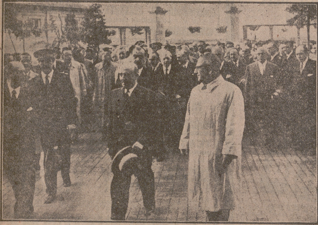
SEVILLA. -- Su Excelencia el Jefe del Estado a su llegada a los talleres de la Empresa Nacional "Eicono", acompañada de ministros y personalidades.

Inauguró una gran fábrica de cemento en Alcalá del Río y entregó numerosos títulos de propiedad en Burguillos