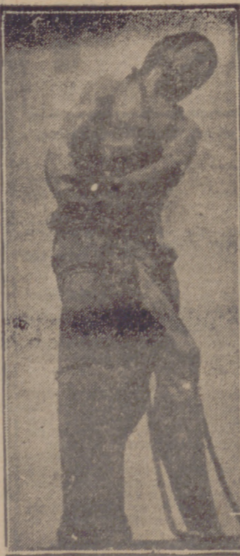
CRISTO ATADO A LA COLUMNA (Iglesia de Santa Cruz)

CARNICERÍA Especialidad en ternero LAZARO ALONSO, 38 - MEDINA DE RIOSECO