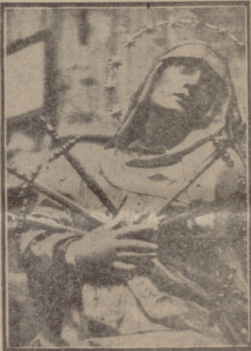
DOLOROSA, DE JUAN DE JUNI.

Sin ánimo alarmista lanzamos el alerta para, todos unidos, contribuir y recabar las ayudas necesarias de los Poderes públicos a fin de que la iglesia de San Francisco sea abierta al culto y la fachada de la de Santa Cruz no sea una amenaza descarada de derrumbamiento, nunca imputable a nuestra pasividad. Es necesario un esfuerzo titánico. Se han de vaciar los bolsillos si queremos conservar nuestro patrimonio artístico o conformarnos con contemplar, impotentes y fracasados, el éxodo mecanizado de una herencia que nos pertenecía y que no hemos sabido conservar.