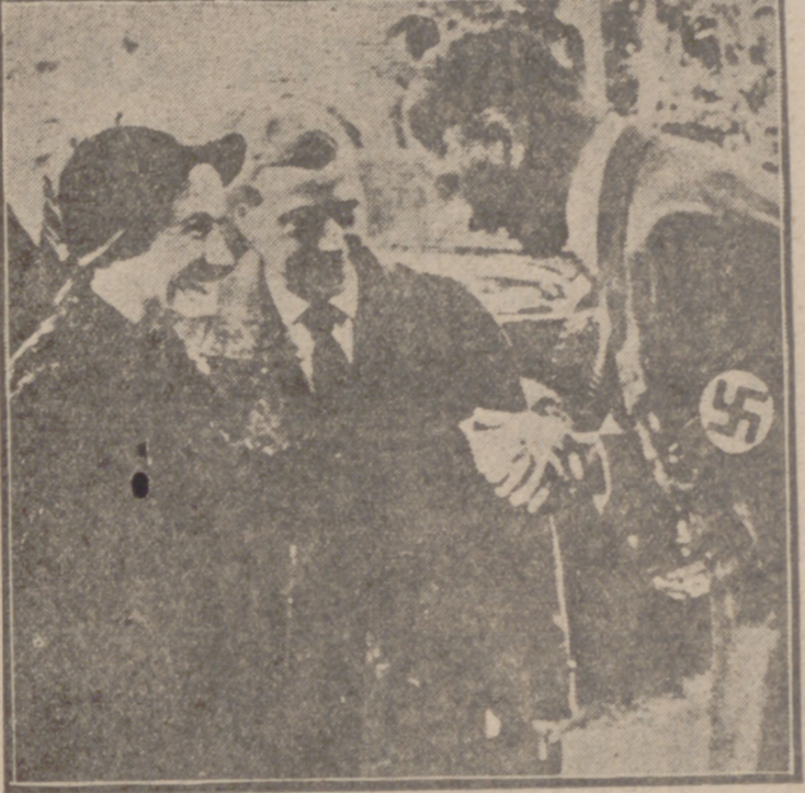
El duque y la duquesa de Windsor en el curso de la visita que hicieron a Hitler, en Berchtesgaden, en el otoño de 1937.