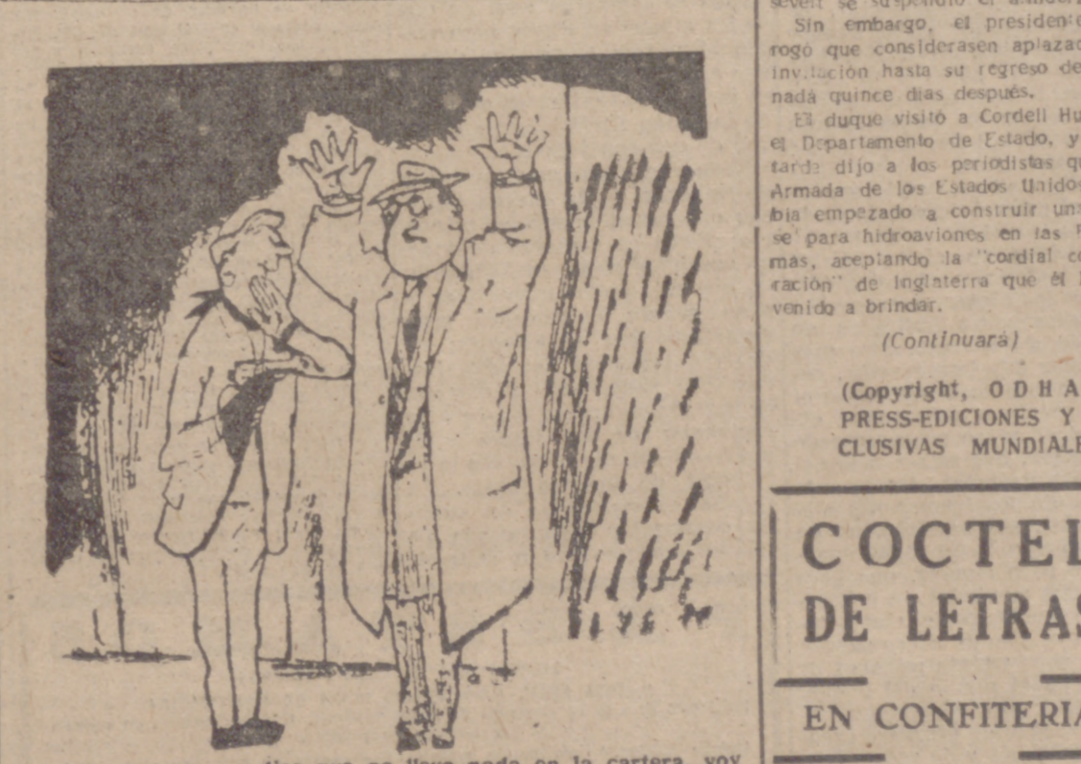
—Puesto que me dice que no lleva nada en la cartera, voy yo también a serle sincero: ¡Tengo descargado el revolver! (De "Ici Paris".)