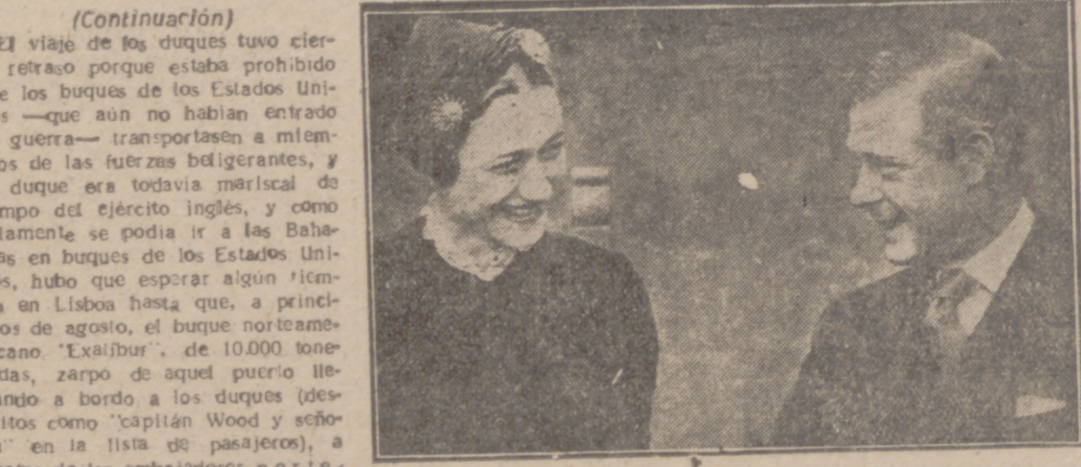
En mayo de 1937, Mrs. Wallis Simpson obtuvo definitivamente el divorcio. Podía casarse ya con el duque. La presente fotografía está tomada en aquellos días.