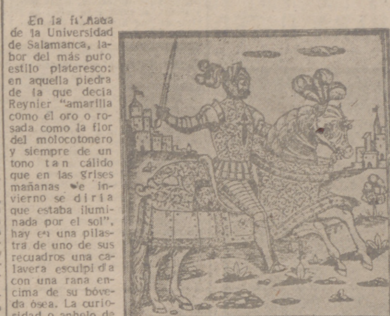
Portada de la Crónica de don Alvaro de Luna (Milán, 1546)