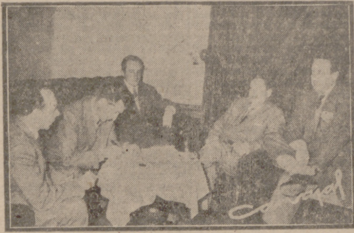
Dionisio Ridruejo departiendo con el delegado y el secretario provinciales de Información, el director de LIBERTAD y el autor de esta entrevista.

El grato momento para conversar con un verdadero poeta como no siempre tal satisfacción, no se agota en la coyuntura que nos brinda el curso del Ateneo, sino que se prolonga en la entrevista con tan alto valor de las Letras, y, considerando un poco su como- dante todo en el ambiente de esa acogida cordial que, obtenimos el fruto de esas horas apenas an- tes de que se cerrara el curso en el Aula Magna de la Universidad.