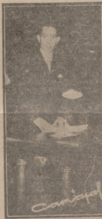
El poeta Dionisio Ridruejo durante su recital poético en el Aula Magna.