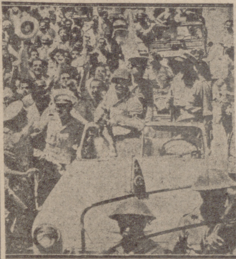
El general Naguib llega triunfalmente a Alejandría

Hasta no hace muchas semanas —antes del golpe de Estado del general Naguib— existían en Egipto dos fuerzas poderosas, inatacables: Una era el rey Faruk, con su poderosa oligarquía, y la otra el Wafd. Entre una y otra, aliándose con una y enfrentándose con otra, sucesivamente, estaba Inglaterra.