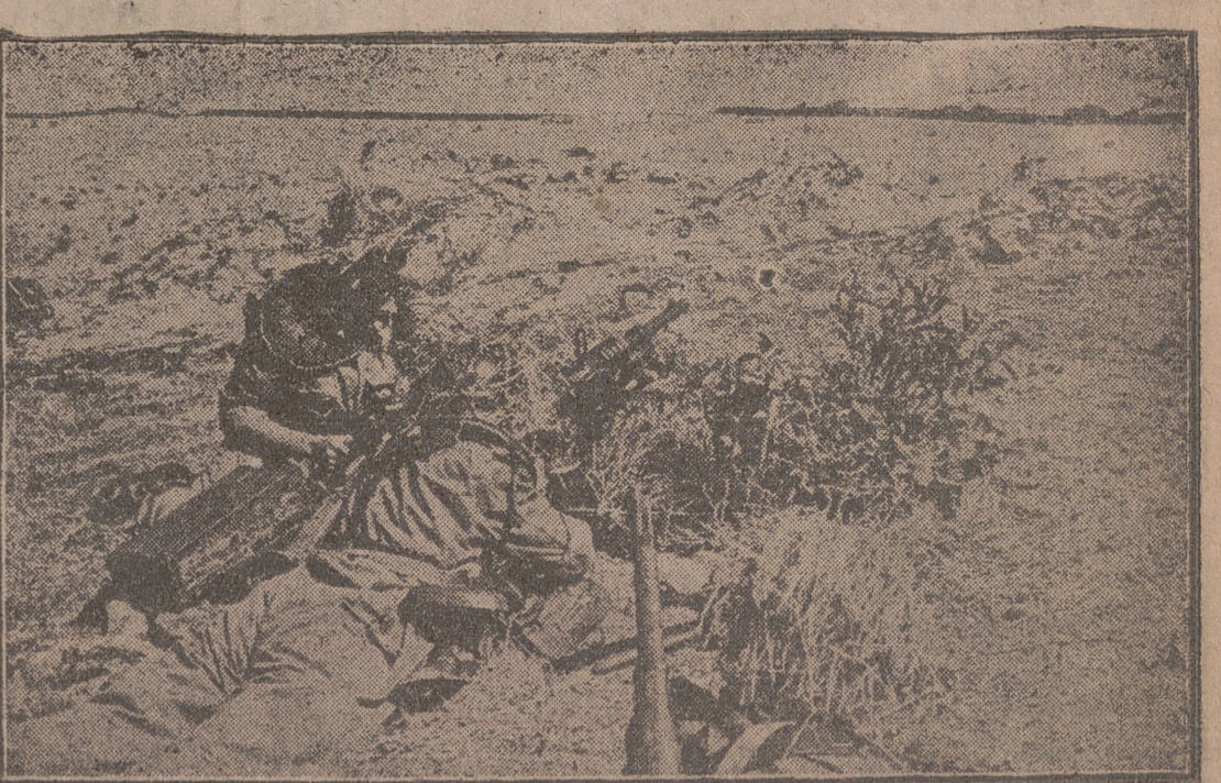
COLMENAR VIEJO.—Los servidos res de un fusil ametrallador, debidamente camuflados, abren fuego sobre una posición enemiga que había de ocuparse posteriormente.