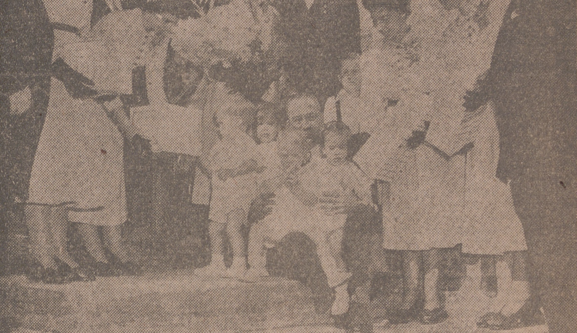
Las Dionne con los cuatrillizos Collus.

A cincuenta millones de pesetas se eleva la fortuna de las gemelas, que han cumplido diecisiete años