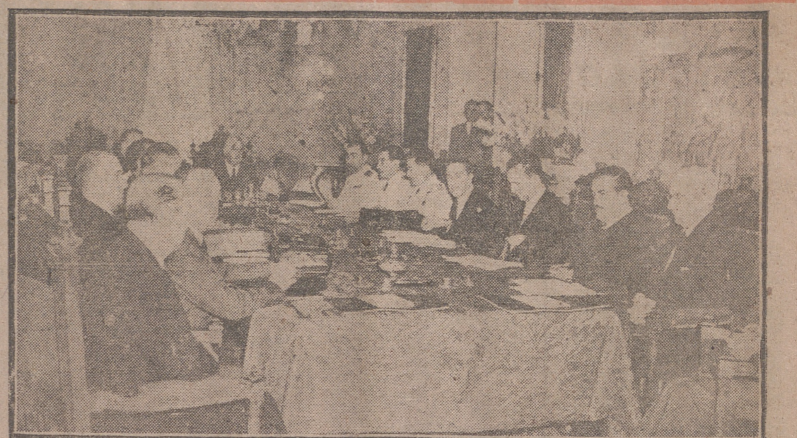
San Sebastián.—Un aspecto de la reunión del Consejo de Ministros en el Palacio de Ayete, bajo la presidencia de Su Excelencia el Jefe del Estado, Generalísimo Franco.—(Foto CIFRA).