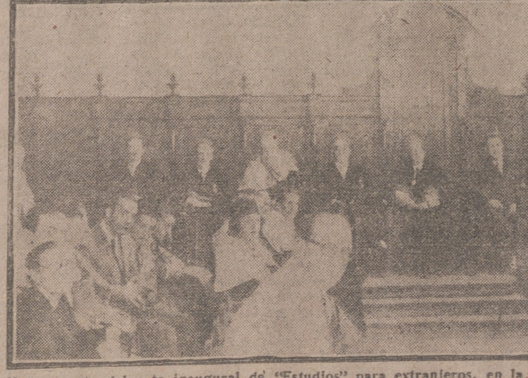
Un momento del acto inaugural de "Estudios" para extranjeros, en la Universidad, presidido por el señor Rector con otras autoridades, y asistencia de miembros del claustro y cursillistas. (Información en tercera página)