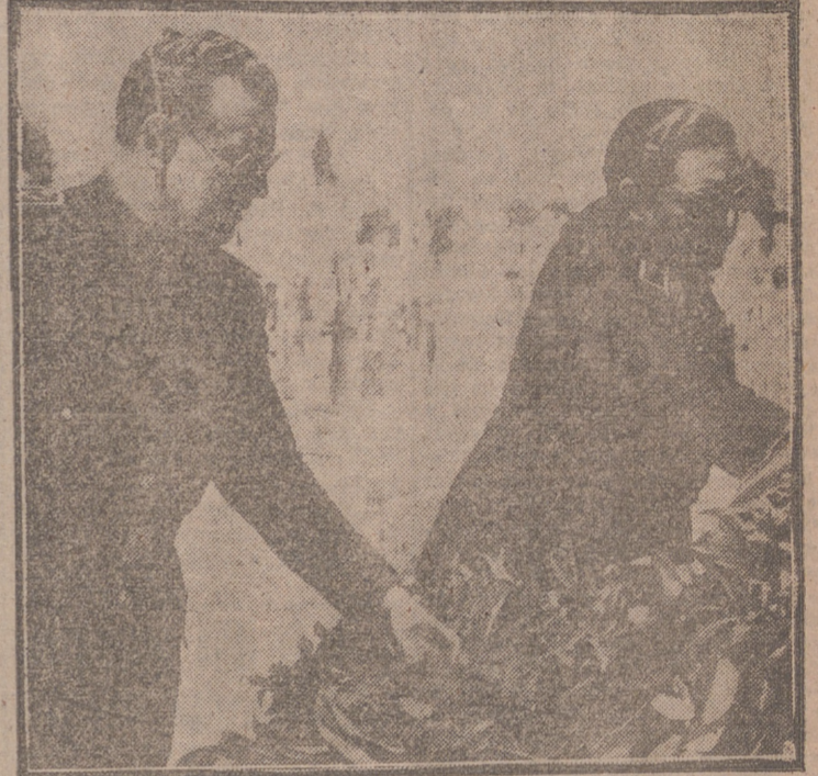
El jefe y subjefe provinciales depositando la corona y (arriba) las principales jerarquías y autoridades asistentes al funeral y acto del Cementerio.