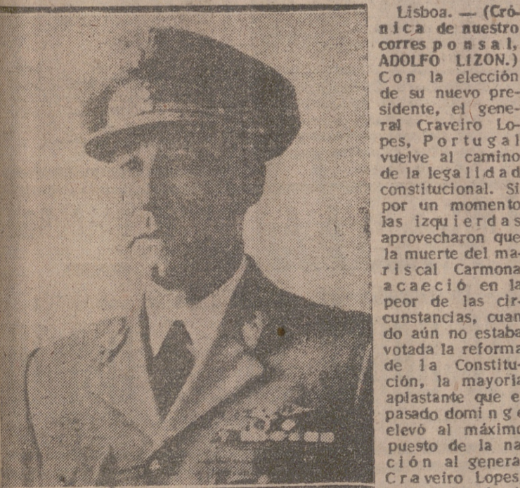
El general Craveiro Lopes, candidato por la Unión Nacional, elegido presidente de la República portuguesa.

posibles. Portugal está con Salazar, y su porvenir más inmediato, asegurado con la elección de su nuevo presidente.