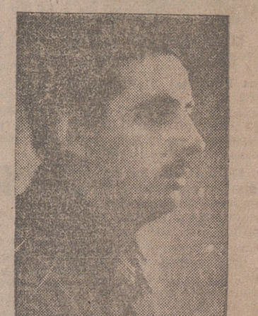
GUTIERREZ DEL CASTILLO

A continuación el general Yagüe clausuró la Semana en vibrantes párrafos, señalando a los maestros cual debe ser la orientación de sus enseñanzas. Exaltó