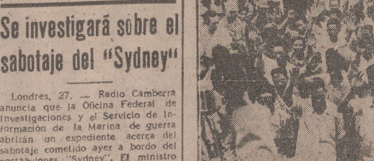
MANILA.—Grupos de "huk" renuncian levantando la mano derecha en señal de acatamiento a las órdenes del Gobierno.