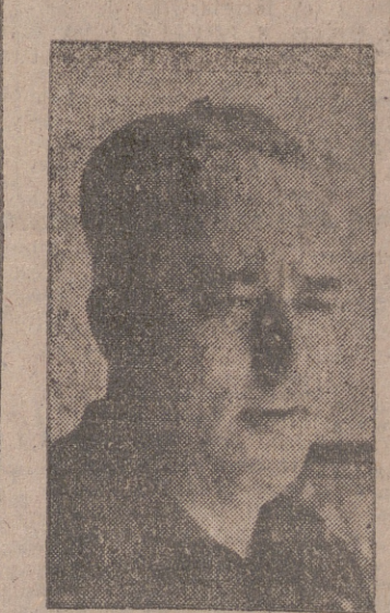
EL GENERAL YAGUE

En ella se estudiaron los problemas actuales del Magisterio