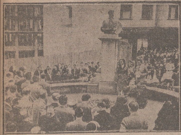
EIBAR.—Un momento de dicho acto en homenaje al hijo predilecto de esta ciudad, Ignacio Zuloaga.