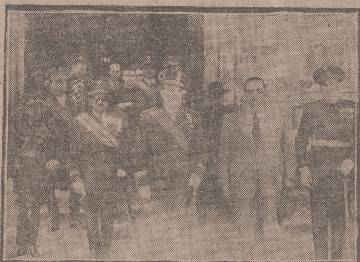
El capitán general y las primeras autoridades a la salida del acto religioso celebrado en la Iglesia de los Filipinos, con motivo de la festividad de Nuestra Señora del Perpetuo Socorro, Patrona del Cuerpo de Sanidad Militar, y un momento del desfile de las fuerzas.