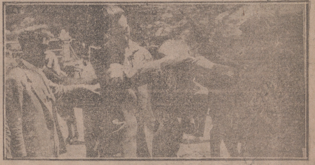
El domingo y el lunes se celebró, en el lugar denominado “El Vivero”, en el pascu de las Moreas, el tradicional ferial de ganado, que estuvo muy concurrido y viéndose magníficos ejemplares. A pesar de la animación se realizaron muy pocas transacciones, pagándose por mulas de cinco y seis años de 25 a 30.000 pesetas. Por caballos jóvenes, de 15 a 20.000 pesetas.—La foto muestra a un posible comprador examinando, por la dentadura, la edad de un borrico, por el que hoy se pide más que por un “haiga”.