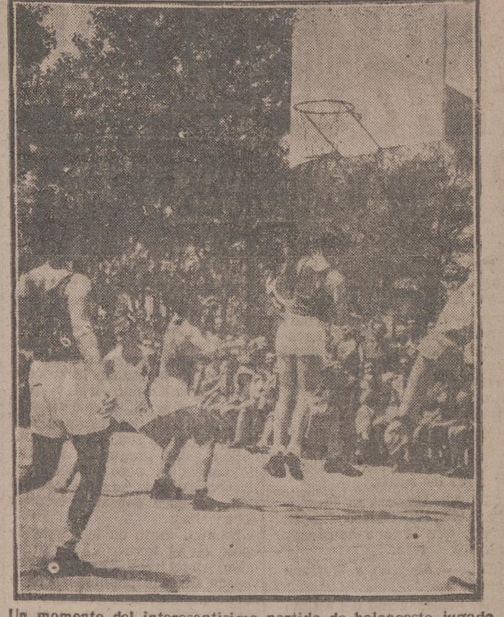
Un momento del interesantísimo partido de baloncesto jugado anteayer entre el San Fernando y el Liceo Francés, que terminó con la victoria de los vallisoletanos.