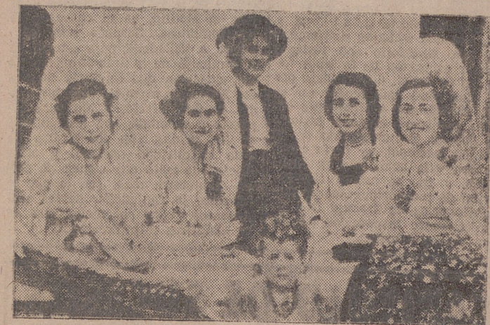
Bellas señoritas que presidieron el festival.