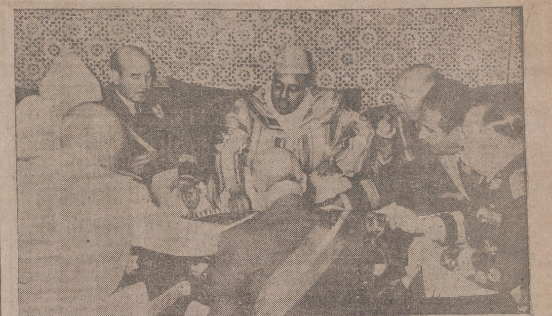
Tetuán.—Su Alteza Imperial el Jalifa obsequió al alto comisario de España en Marruecos, teniente general García Valiño, con una cena de gala en el palacio de Mexuar, momento que recoge la fotografía.