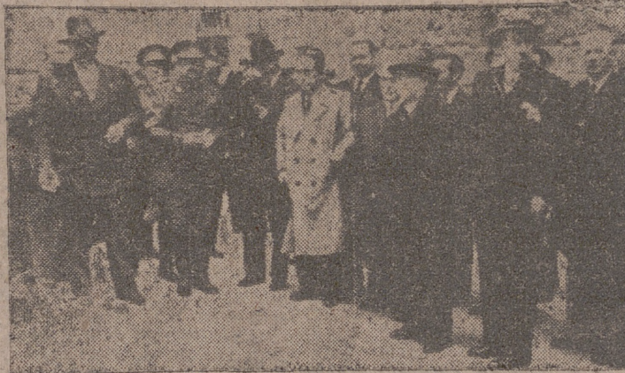
Las autoridades, a la salida de la misa.