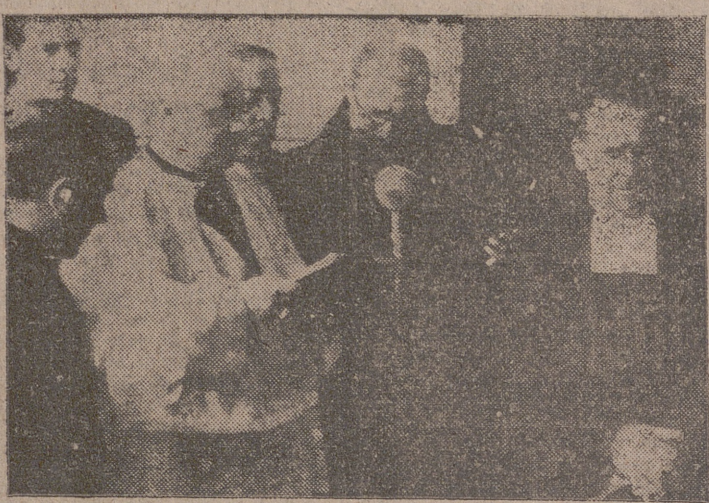
El Abad mitrado de la Trapa bendijo el nuevo Estadio La Salle, del Colegio de Lourdes.

Han comenzado con extraordinaria brillantez las fiestas del tricentenario de San Juan Bautista de la Salle.