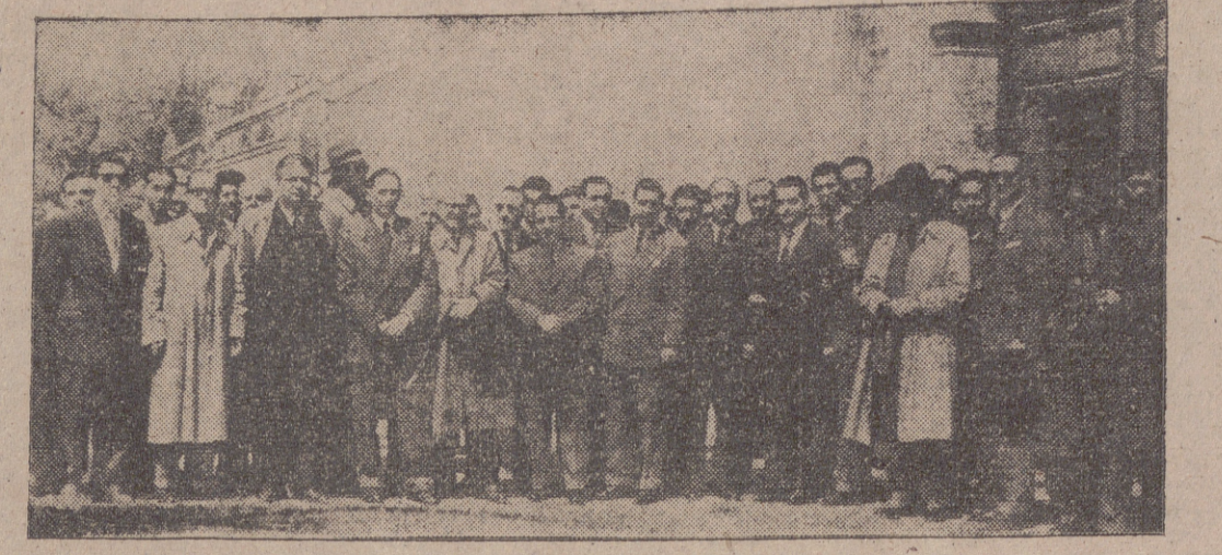
Autoridades, jerarquías sindicales y asegurados asistieron a la misa celebrada en San Lorenzo

TRAS UNA MISA EN SAN LORENZO, TUVO LUGAR LA TRADICIONAL COMIDA DE HERMANDAD