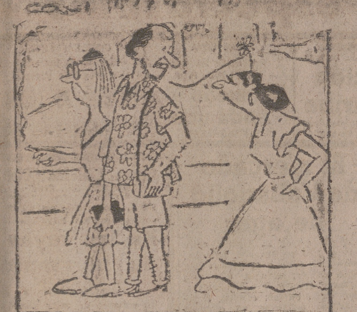
—¡Adiós, Tarzán!... Ten "cuidao" con la mona, no se "v escape"...

Los rusos siempre mostraron gran admiración por la técnica alemana. Recientemente entró en un taller de relojería de Berlín un soldado ruso cargado con un monumental reloj de pared, que depositó sobre el mostrador.