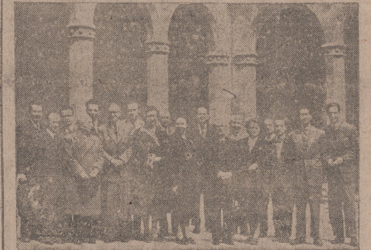
Los visitantes fotografiados en el patio del Colegio de Santa Cruz (INFORMACION EN LA PAGINA CUARTA)

otras divisiones de las Naciones Unidas, dispuestas a saltar el paralelo 38 en cualquier momento que quieran y por cualquier punto a lo largo de la línea de combate, de más de 180 kilómetros de longitud.—Efe.