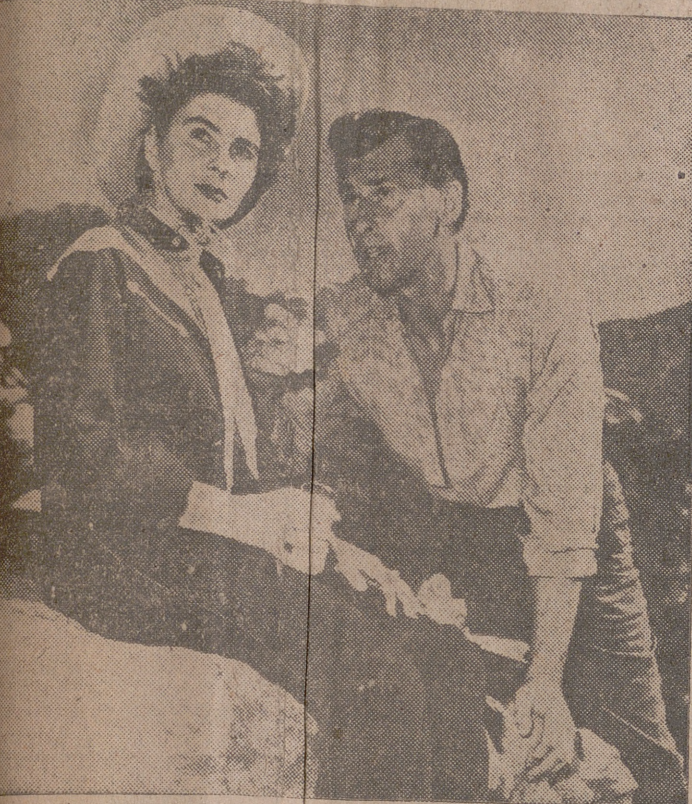
Stewart Granger y Jean Simmons almuerzan al aire libre durante el rodaje de la película Metro Goldwyn 'Tres soldados'.