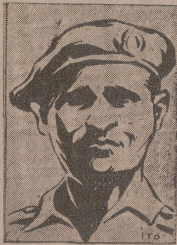
EL CAPITAN WESTERLING