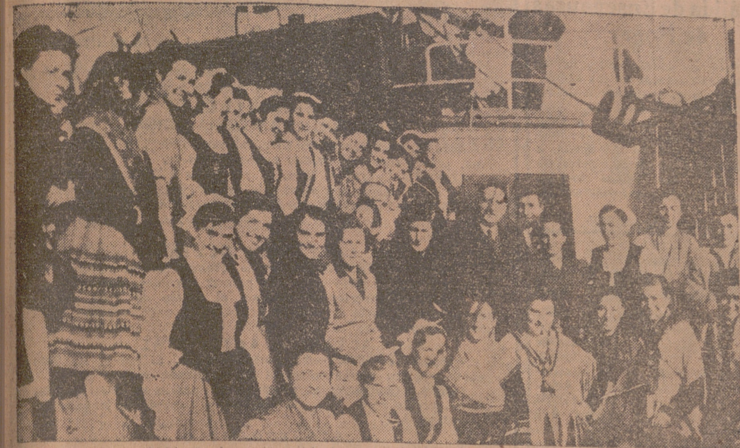
BARCELONA.—Las muchachas de los Coros y Danzas de la Sección Femenina que han realizado una triunfal gira artística por tierras de Egipto y Oriente Medio, fotografiadas junto a la delegada nacional, Pilar Primo de Rivera, y el gobernador civil de Barcelona, que acudieron a recibir las.