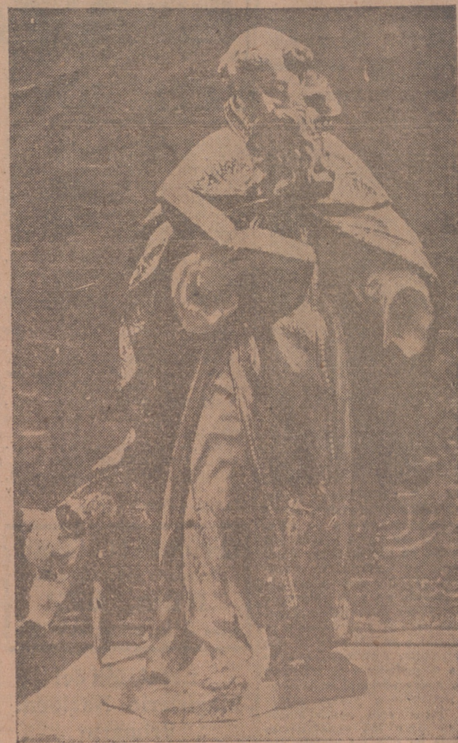
Hoy celebra la Iglesia la fiesta de San Antonio Abad, del que ofrecemos a sus devotos y a nuestros lectores esta magnífica escultura policromada, perteneciente al valioso relicario de la Colegiata de Villagarcía de Campos, de nuestra provincia. La presente reproducción fotográfica, obra de Garay, inédita hasta hoy, nos ha sido gustosamente facilitada por el culto profesor de Arte de nuestra Universidad, don Esteban García Chico. La belleza de esta obra escultórica, de autor desconocido, bien merece sea dada a conocer. Y la fecha de hoy es buen motivo para hacerlo.