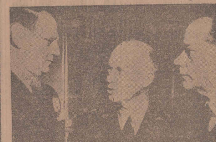
COPENHAGUE.—El general Eisenhower, comandante supremo de las fuerzas del Pacto Atlántico (centro), fotografiado con el rey Federico de Dinamarca (izquierda) y el almirante Quistgaard.