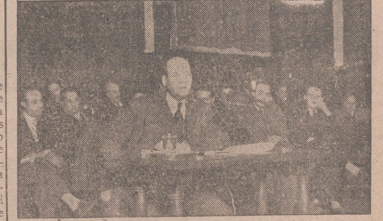
El famoso profesor durante su disertación.

Roma, 15. —Ha sido entregada al ministro de Asuntos Exteriores de Italia, Nenni, una nota británica relativa a la