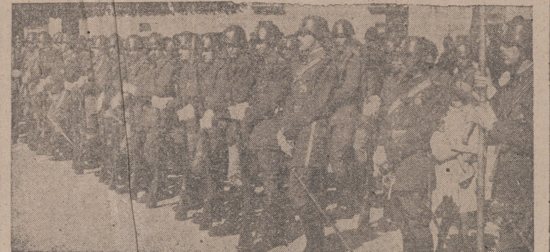
COMPANIA QUE RINDIO HONORES.

Ayer se celebró en nuestra ciudad, al igual que en años anteriores, la Fiesta del Caudillo con una recepción en Capitania General en homenaje y adhesión a Su Excelencia el Jefe del Estado, representado en las primeras autoridades militares, civiles y eclesiásticas de Valladolid.