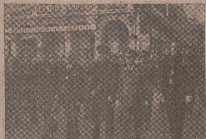
Primeras autoridades militares y civiles y del Movimiento en la presidencia del gran acto religioso.