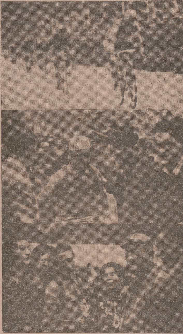
De arriba a abajo: Llegada de los corredores a la meta. Fombellida gana la etapa al sprint.—Los familiares del vencedor vallisoletano le saludan.—El vencedor recibe un ramo de flores, obsequio del Valladolid Ciclista.

Deportivo La Antigua-Juventud C. F., a las cuatro de la tarde. Arbitro, señor Lorenzo.