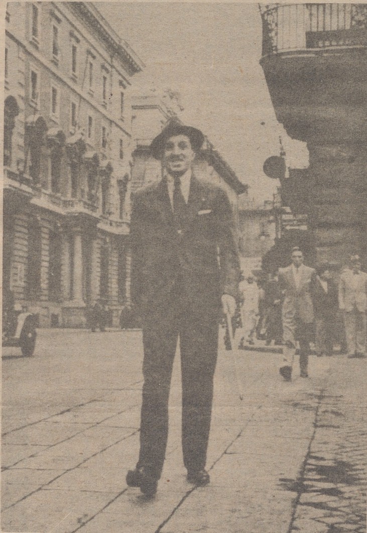
«En una de mis conversaciones en Roma con Alfonso XIII le oí decir: "Si hubiera existido «Acción Española» diez años antes yo no estaría aquí.» Sobre estas líneas, el Monarca, en el destierro, pasea por la Ciudad Eterna.

Larraz nos cuenta en su libro «El poder político» cómo le decía Romanones lo siguiente: «Me moriré liberal, pero no quiero nada con ese tipo de democracia. No conozco destructor más grande de la libertad