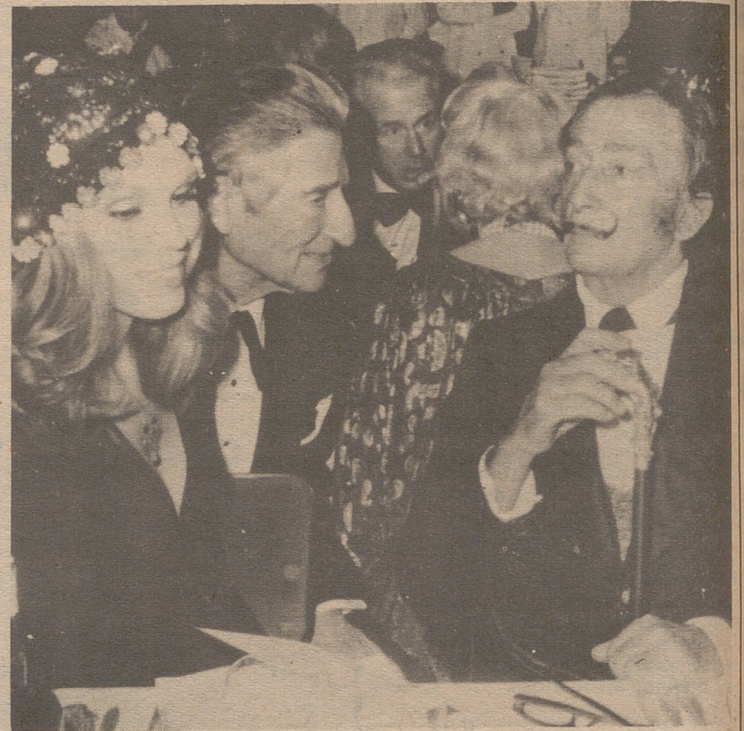
PARIS. El famoso pintor Salvador Dalí con Amanda en la gala del Lido de Paris en la premier de show "Bonjour la Nuit". (Foto Ap-Europa Press).