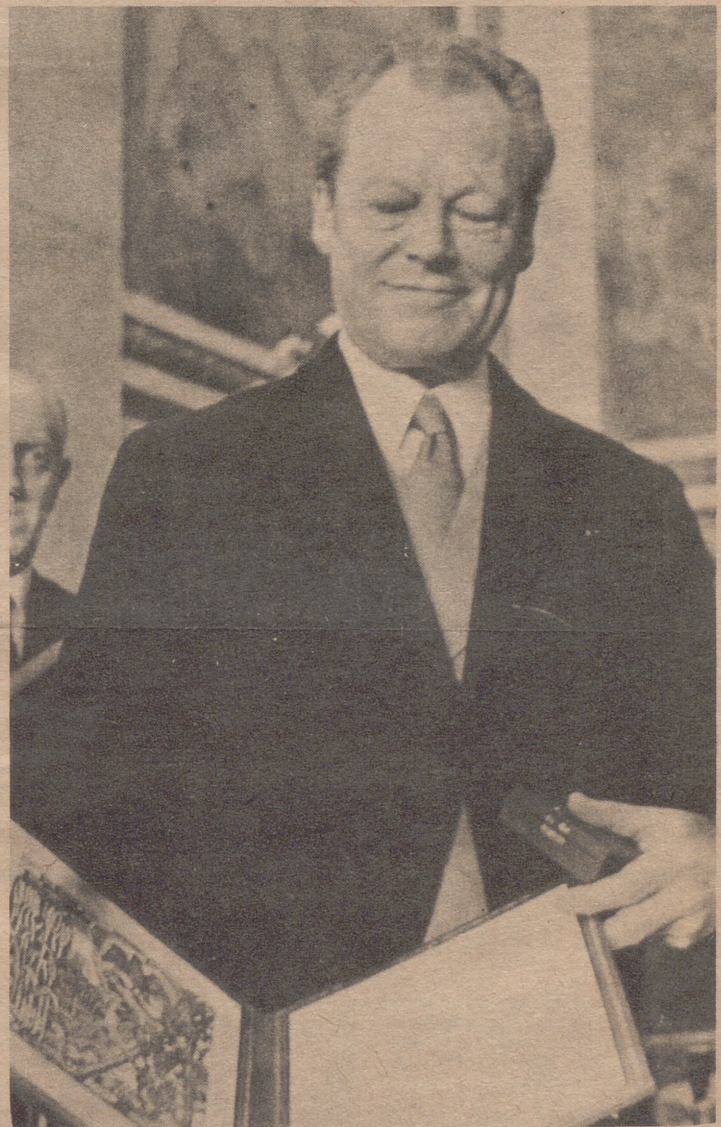
OSLO.— El Canciller de Alemania Federal Willy Brandt después de recibir el Premio Nobel de la Paz 1971 en Oslo.