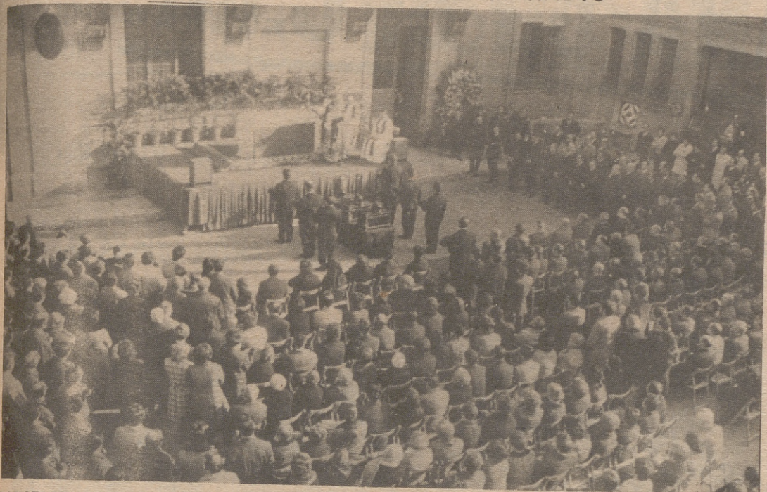
BARCELONA.— Una impresionante manifestación de que lo ha constituido el acto del sepelio de los tres bomberos fallecidos en el incendio de la factoría "Iberia Radio" en días pasados. Ofició la misa el Primado Arzobispo Marcelo González Martín.