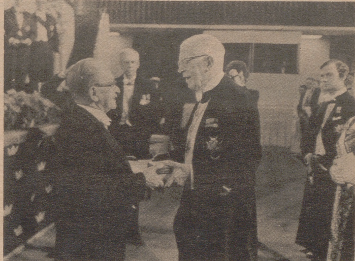
ESTOCOLMO.— El Rey Gustavo Adolfo de Suecia haciendo entrega del premio Nobel de Física al Dr. Dennis Gabor. En la foto a la derecha, el príncipe Carlos Gustavo y la princesa Sibylla.