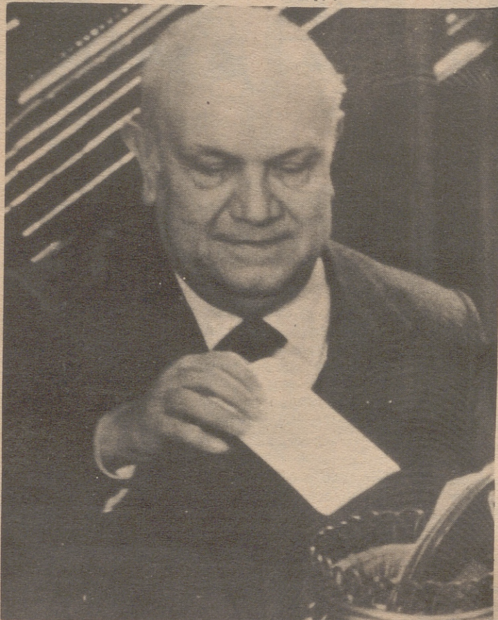
ROMA.— El vicepresidente italiano Francesco De Martino de 64 años, candidato del frente izquierdista, depositando su voto en las elecciones presidenciales italianas. El ha obtenido hasta ahora el mayor número de votos, 404, aunque no son suficientes para ganar.