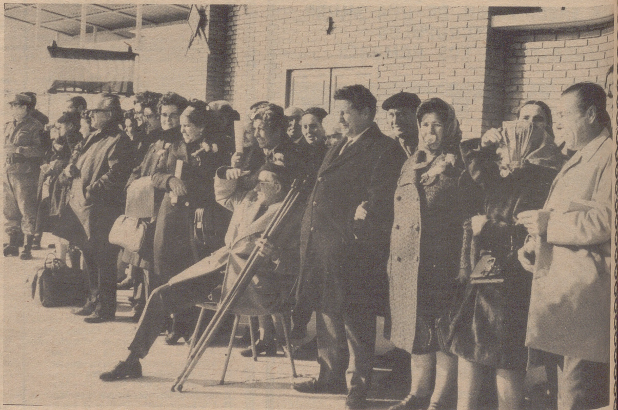
Las cien familias contemplan los ejercicios de instrucción y gimnasia que efectúan los reclutas.