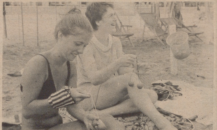
VINAROS (Castellón).— Dos turistas juegan a eso tan de moda, en las playas de Vinaros. Como muy bien las definió un humorista, son dos bolitas que penden de un cordel, se hace así y se molesta". De nada.

¡Nueva temporada cinematográfica! LUNES, GRANDES ESTRENOS ¡EL MAYOR EXITO DEL VERANO EN EL CINE KURSAAL DE SAN SEBASTIAN! ¡UN GRAN FILM, MODERNISIMO, PROFUNDO EN SU TEMA, NO LLEVADO NUNCA AL CINE!