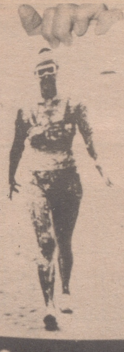
NUEVA YORK.— Gertrude Ederle, es la primera mujer que cruzó a nado el Canal de la Mancha el 6 de agosto de 1926. Gertrude en la actualidad fotografiada con ocasión del banquete celebrado en su honor por la Cámara de Comercio de Flushing.