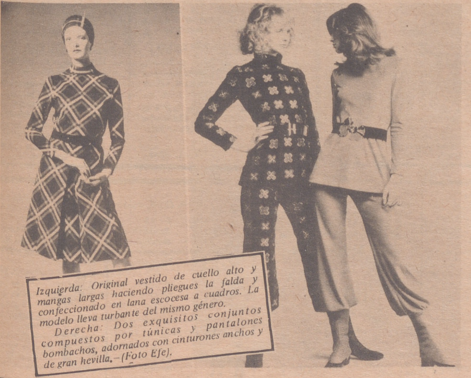
Izquierda: Original vestido de cuello alto y mangas largas haciendo pliegues la falda y confeccionado en lana escocesa a cuadros. La modelo lleva turbante del mismo género. Derecha: Dos exquisitos conjuntos compuestos por tunicas y pantalones bombachos, adornados con cinturones anchos y de gran hevilla.