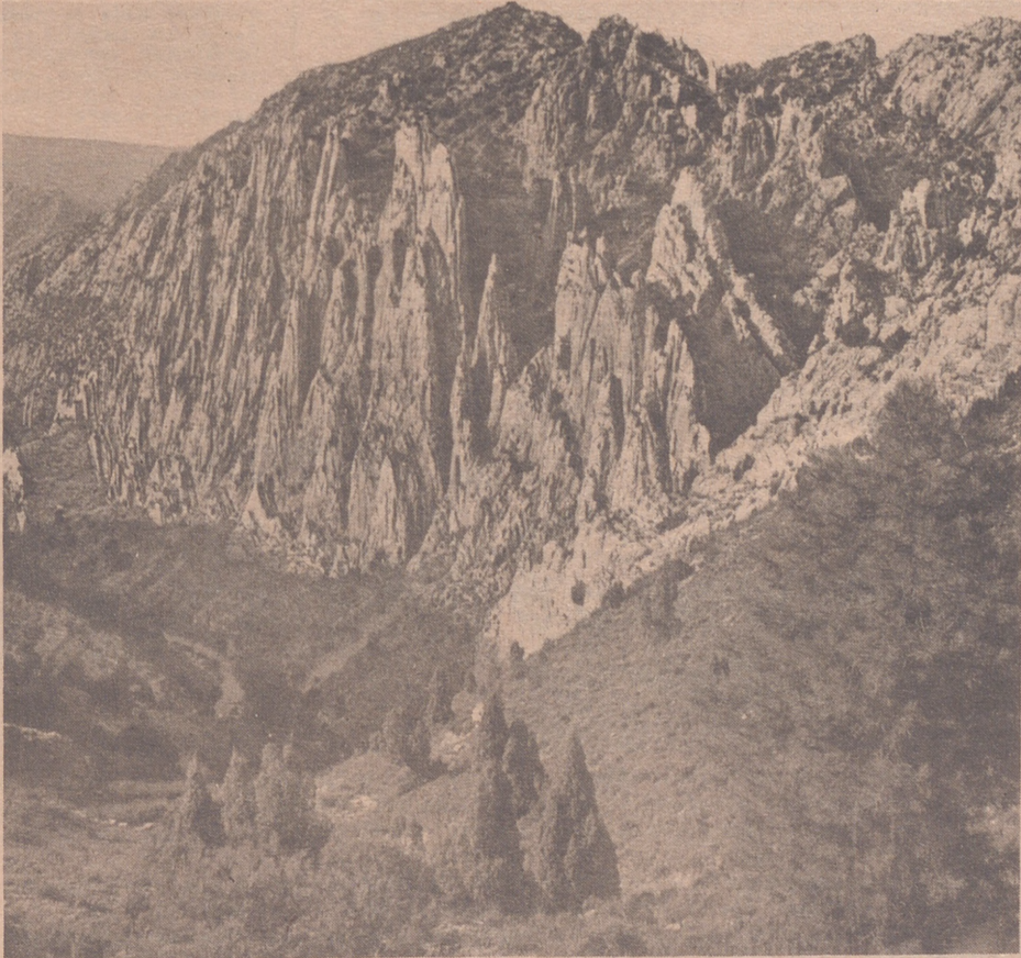
Los organos de Montoro en los montes del Maestrazgo (Teruel)

HORA es buen tiempo para hacer turismo en Aragón. De esta fuente de riqueza se trató brillante y profundamente en el reciente Consejo Económico Sindical Interprovincial del Ebro (C. E. S. I. E.) de tanta importancia en el valle Ibérico.