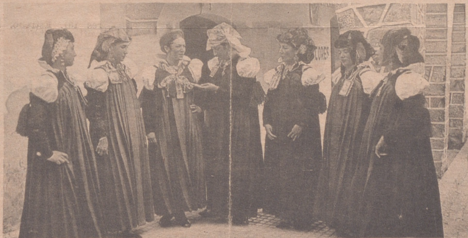
Trajes típicos de la Jacetania. Ansó (Huesca)