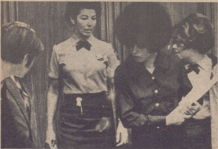
La militante negra Angela Davis, hablando con su abogado