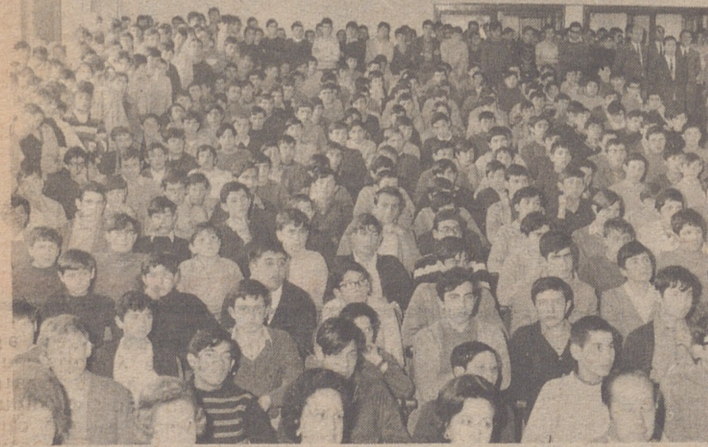
Presidido por el Delegado provincial de Sindicatos, presidentes de federaciones, Director de la Institución Virgen del Pilar y profesores se celebró el reparto de premios deportivos que en las modalidades de Fútbol, Tiro, Pelota, Baloncesto, Balonmano han participado, los alumnos de dicha Institución. Un acto emotivo y brillante.

UN PESQUERO ITALIANO EMBARRANCA Y QUEDA PARTIDO EN DOS