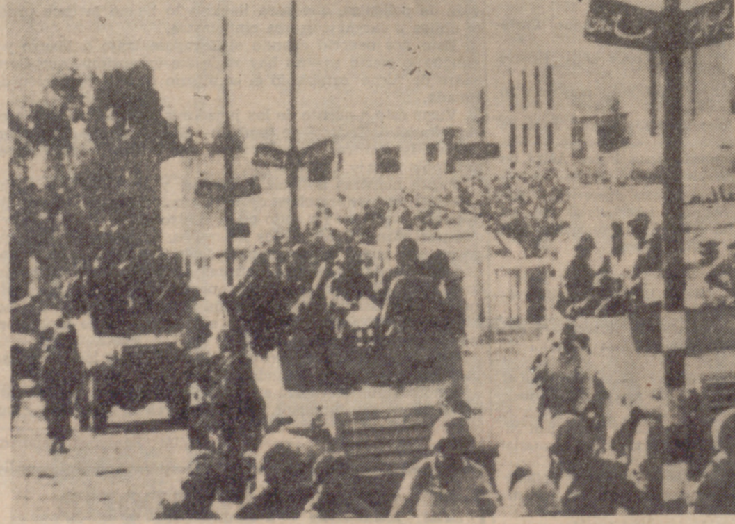
GAZA.—Tropas israelíes y vehículos armados, por las calles de Gaza después de la toma de la ciudad.

do, a despreciar los tópicos. La ironía es el más energético antídoto contra el fanatismo. Nosotros tuvimos en "Arriba" el milagro comprimido diario de aquel fabuloso irónico que fue don Eugenio d'Ors. Y la semana y angélica burla es peripentica de Ramón Gómez de la Serna. Y la cobertura clásica de Rafael Sánchez Mazas, que bautizaba el escepticismo romano con la mejor prosa castellana. "Arriba" fue el último recuento español de los liberales con je en el destino comunitario de nuestro