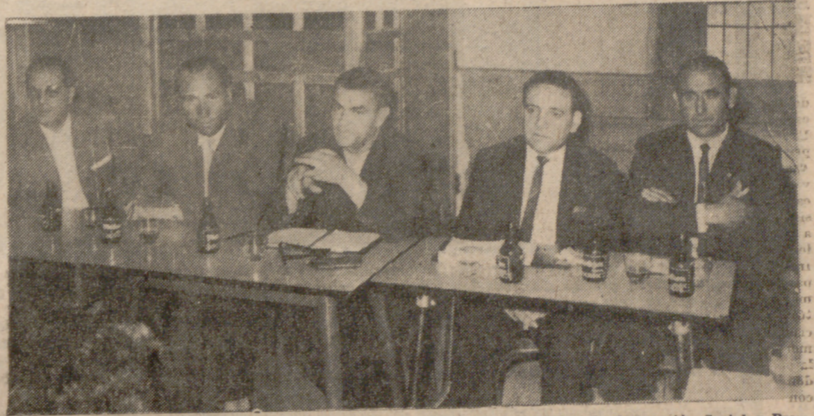
El Delegado Provincial de Sindicatos, Alcalde de la localidad, Vicepresidente de Ordenación Social y Presidente del Consejo Provincial de Trabajadores, presidiendo la reunión en Roales de Campos.