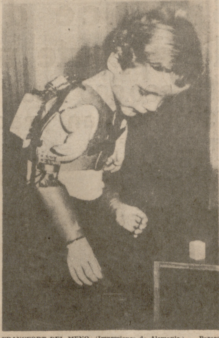
FRANCFORT DEL MENO. (Impresiones de Alemania). — Parece una pequeña maravilla esta prótesis de brazo para niños inválidos, desarrollada por médicos y técnicos de la Clínica Ortopédica de la Universidad de Francfort del Meno (República Federal de Alemania). Las manos postizas funcionan casi como miembros naturales. Con los dedos de sus manitas cortas el niño mismo puede, por medio de células de palpación, poner en marcha el mecanismo electro-hidráulico en sus espaldas y provocar así los movimientos deseado. El sentido en las puntas de los dedos lo substituyen elementos sensibles que dan señales electrónicas cuando, por ejemplo, la mano haya agarrado firmemente un objeto. Mediante el aparato los niños pueden jugar y ejecutar las necesarias manipulaciones de la vida cotidiana.