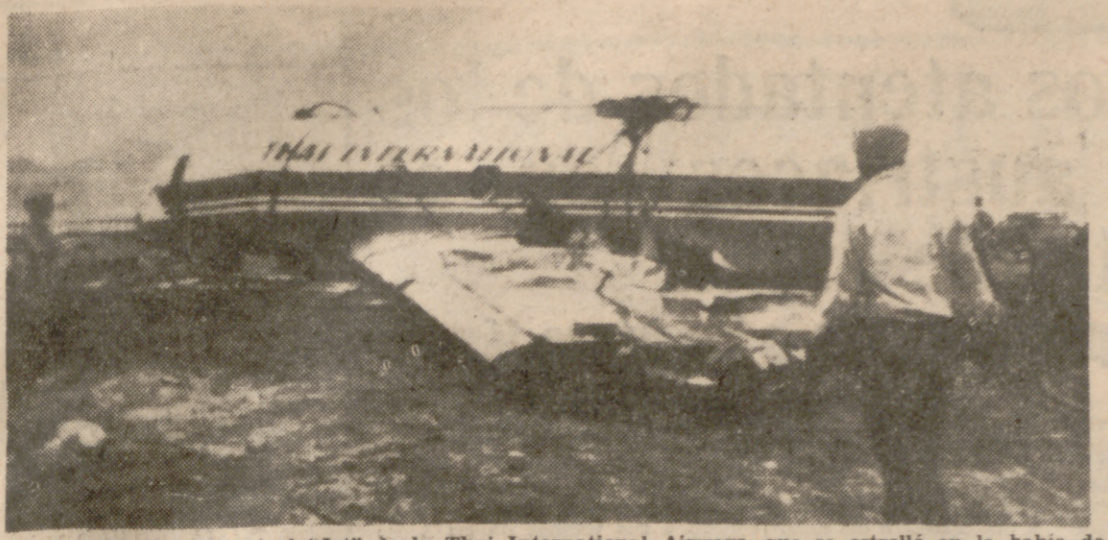
HONG-KONG.—Este es el «Jet» de la Thai International Airways, que se estrelló en la bahía de Kwloon.