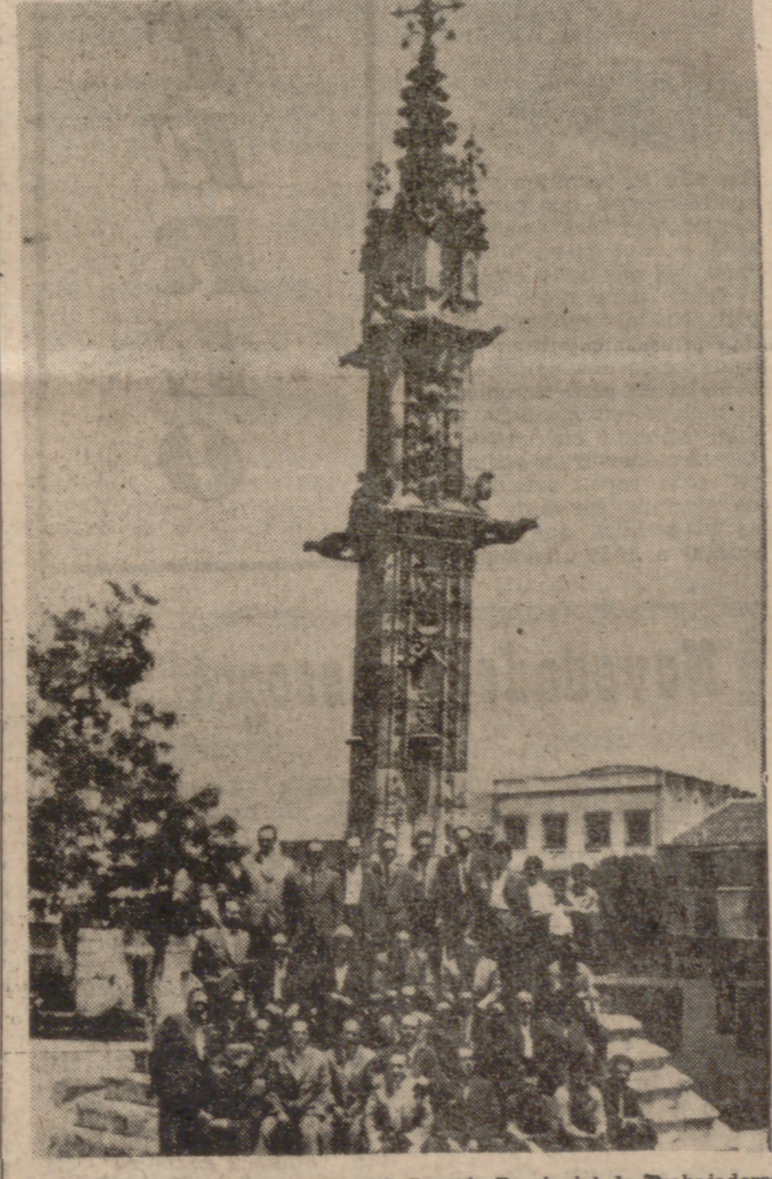
Los miembros de la Permanente del Consejo Provincial de Trabajadores y obreros de Villalón, posando ante el "rollo".