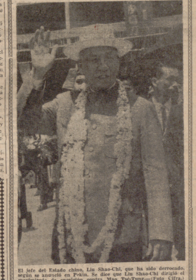
El jefe del Estado chino, Liu Shao-Chi, que ha sido derrocado, según se anunció en Pekín. Se dice que Liu Shao-Chi dirigió el movimiento de oposición contra Mao Tsé-Tung.