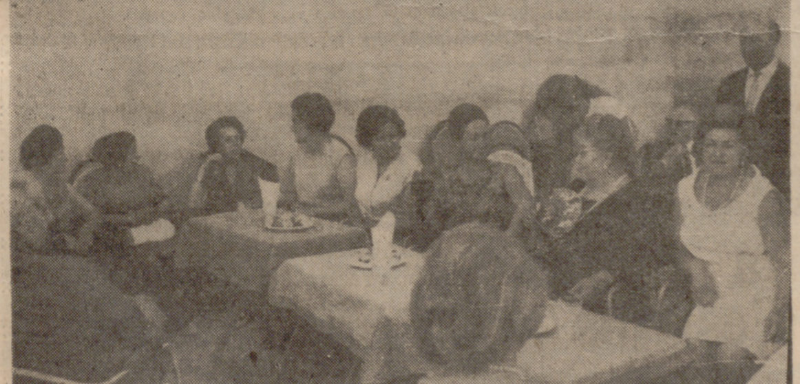
En la finca "San Pedro-Tierra que la Asociación de la Prensa Pinarens" se celebró en la tarde ofrece a su cuadro médico. Con los facultativos y sus familias asistieron a la grata fiesta los periodistas vallisoletanos, acompañados de sus distinguidas esposas y sus hijos solteros.