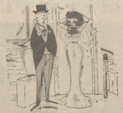
-Ninguna novedad. ¿Y tú?