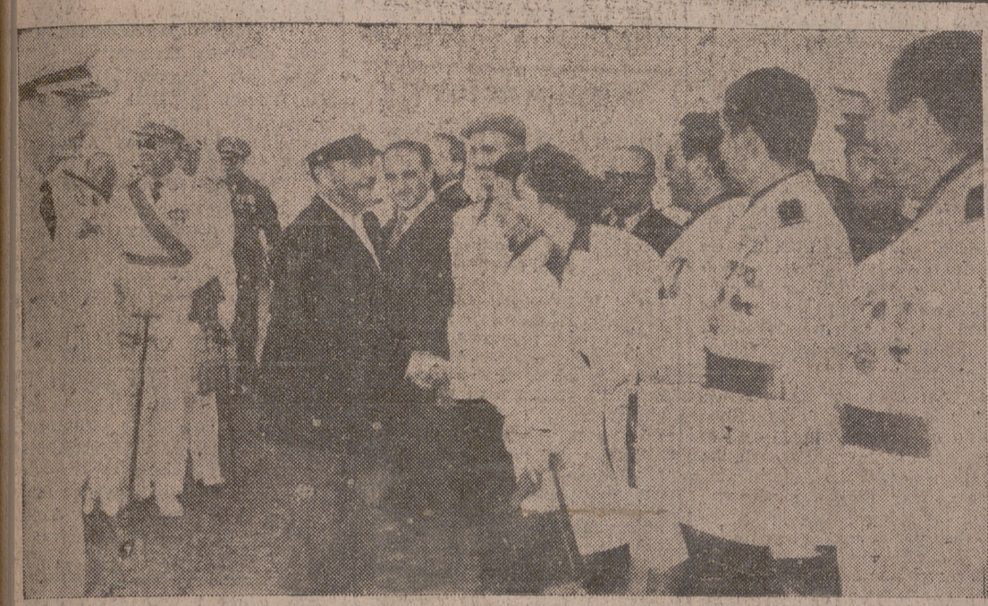
S. E. el Jefe del Estado es cumplimentado por las autoridades civiles y provinciales al desembarcar en el puerto de Sala, al que llegó a bordo del yate "Azor". Desde allí se dirigió al Pazo de Meirás.