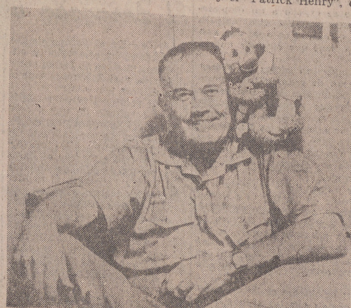
El contralmirante Raborn, en la quietud de su hogar, sonríe satisfecho, después de conocer el éxito obtenido.