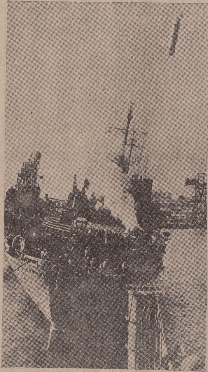
La primera prueba verificada en el Golfo de Méjico. Desde una nave, los científicos ven aparecer el proyectil que luego seguiría camino del supuesto blanco.