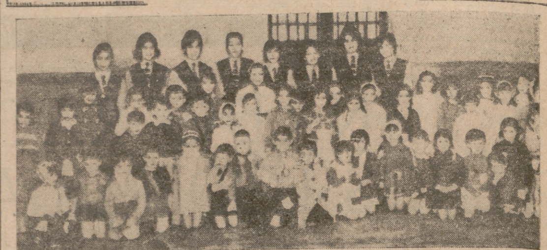
Con ocasión de celebrar el Colegio de la Sagrada Familia (Jesuitinas) el Día de la Reverenda Madre Superiora, se celebraron diversos actos. En la fotografía, grupo de alumnas que intervinieron en las representaciones teatrales.