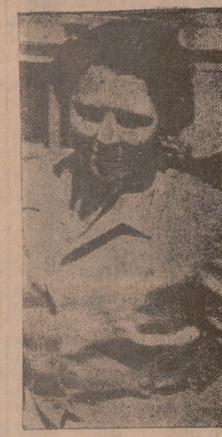
Princesa Beatriz de Holanda

Durante su reciente viaje por Estados Unidos, la princesa Beatriz de Holanda fue entrevistada varias veces por los periodistas. La hicieron una pregunta ya clásica en este país: "Si se enamorara de un hombre que no fuese de su categoría, se casaría con el renunciando a los derechos incluso cambiar todos los