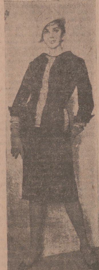
Un traje sastre de lana, color "humo de Londres", con la delantera abotonada sobre una blusa de cuadros, puede servir también para la noche.

Feminismo acentuado y muchas flores PRIVAN LAS CAPAS Y EL TRAJE SASTRE