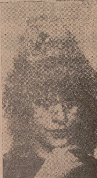
Vean ustedes el modelo "Volatin", un sombrero con velo azul en forma de pílón con una joya delante como adorno. Ha sido presentado por Claude Saint Cyr en su exhibición de la moda de primavera de 1960 de los nuevos sombreros parisinos.