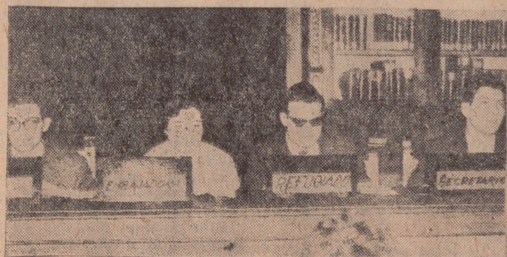
Un momento de la lectura de "El agua en las manos".

Con una profundidad de conocimientos en la materia poco comunes, el orador recuerda los años gloriosos del teatro, durante la Cruzada, en Pamplona, donde tuvo una época de esplendor para terminar languidiendo, más tarde, se detiene minuciosamente en el estudio de "Historia de una escalera", de Buero Vallejo, que fue acogida con el mismo público teatral con que se acogió a Camilo