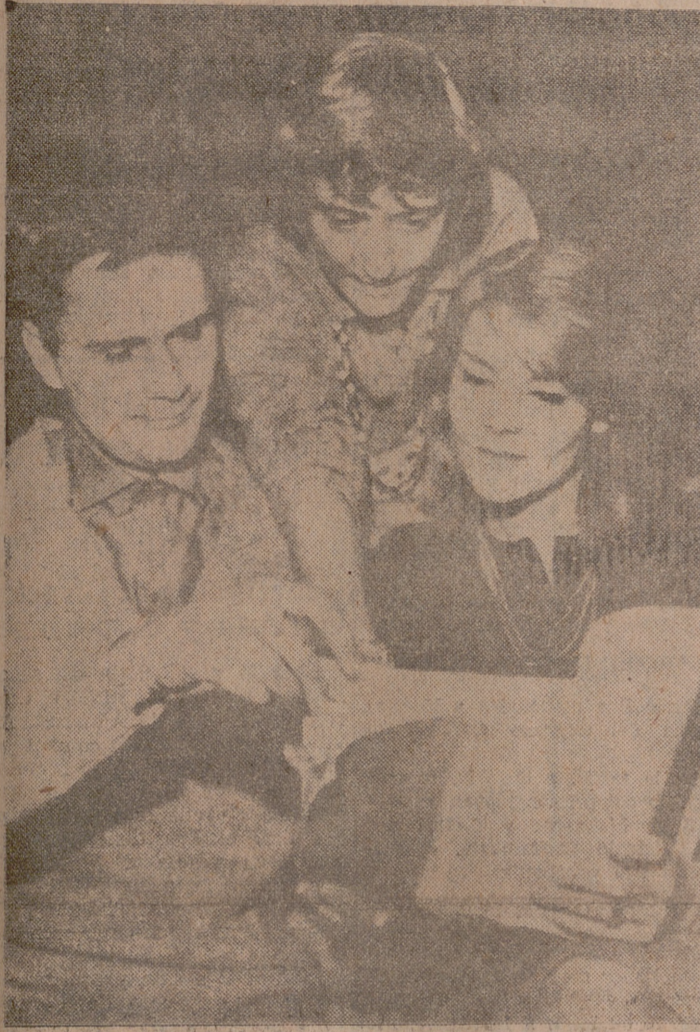
En el Teatro del Atelier, de París, han comenzado los ensayos de la comedia "Un castillo en Suecia", de que es autora la célebre Francoise Sagan. La obra, basada en una intriga sentimental, es una pieza de humor. Francoise Brion y Roger Pelletier serán los protagonistas. Ambos aparecen en la foto con la autora, que puntualiza unos detalles del texto durante uno de los ensayos.