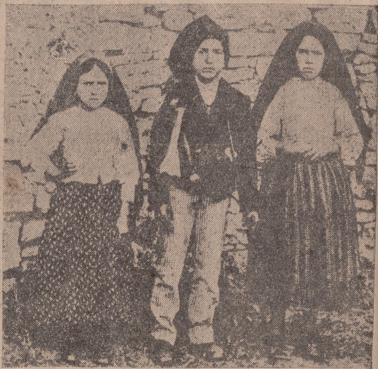
Los tres pastorcillos, a quienes, en el año 1917 se les apareció la Virgen cuando cuidaban el ganado en el mismo campo donde ahora está el Santuario de Fátima.

Reproducimos la respuesta dada por los directores de los dos principales diarios católicos italianos. La pregunta es la siguiente: ¿Cuál es la noticia que usted desearía publicar este año en una edición extraordinaria de su periódico?