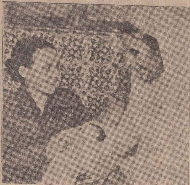
Llevada por su gran fe y amor a la Virgen, esta portuguesa quiso dar a luz en Fátima. Ahora, satisfecha, con el niño en brazos, que ha ofrecido a Nuestra Señora.

"Kruschev envía un telegrama al Papa para abjurar del ateísmo y ser recibido en la Iglesia Católica. Los pueblos de la Unión Soviética buscan afanosamente sacerdotes para abrir de nuevo las iglesias y escuchar la santa misa. Ha sido convocada en Praga una Conferencia Internacional para resolver el problema de la falta de obispos católicos en los países que estaban tras el telón de acero. Se darán cursos acelerados de historia y doctrina católica a todos los activistas de los partidos comunistas de Europa oriental y occidental para prepararlos a la práctica religiosa. Todos los componentes del Comité Central del P. C. U. S. realizarán una peregrinación a Roma antes de celebrar su Congreso. En adelante no se condenará ya a nadie por delitos políticos. La libertad ha sido asegurada. El ejército soviético ofrece sus mejores satélites para dar escolta de honor a la procesión de apertura del Concilio Euménico convocado por Juan XXIII. A una noticia así, yo la titularía: "La distensión es un hecho serio."—(PA).