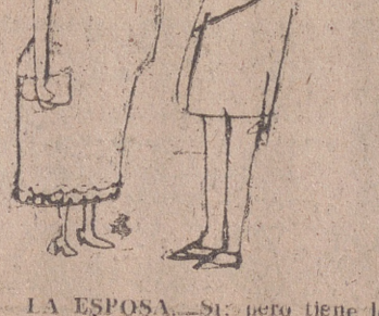
LA ESPOSA.—Sí, pero tiene los pies gritueros.