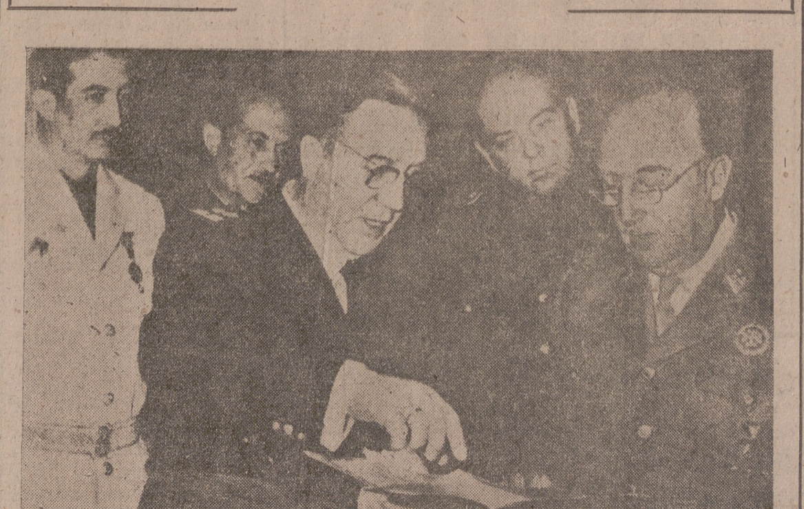
S. E. el Jefe del Estado recibió en audiencia, en el Palacio de El Pardo, el Consejo Económico Sindical de Palencia, presidido por el Ministro Secretario General del Movimiento, y examinó los estudios sobre la transformación de la Tierra de Campos.