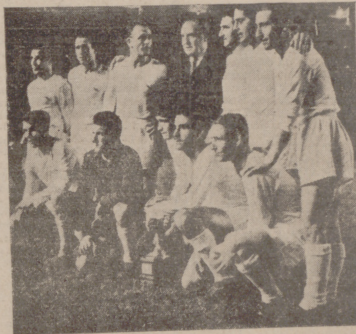
EL REAL MADRID

Y, finalizando, en hockey sobre patines sigue España en primerísimo plano. Conquistó el Campeonato