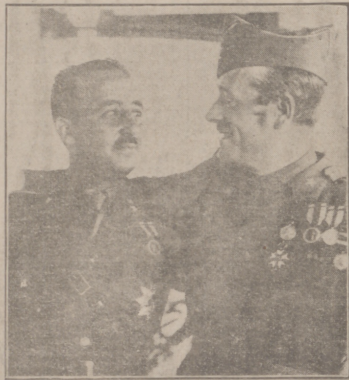
Una foto histórica: Franco con Millán-Astray.

Fue precisamente en una fecha como ésta cuando uno de los personajes más gloriosos de la Historia española dijo adiós a los humanos. La noticia llegó en las primeras horas de la mañana de hoy hace exactamente cuatro años. El general José Millán-Astray y Terreros acababa de morir. Murió como correspondía a un caballero, con una muerte como solamente le es dable alcanzar a un modelo de hombría y sencillez. Exhalando el último suspiro en una fecha como era el último día del