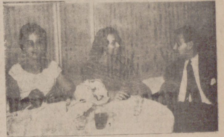
Señores de Moreno, en el Casino.