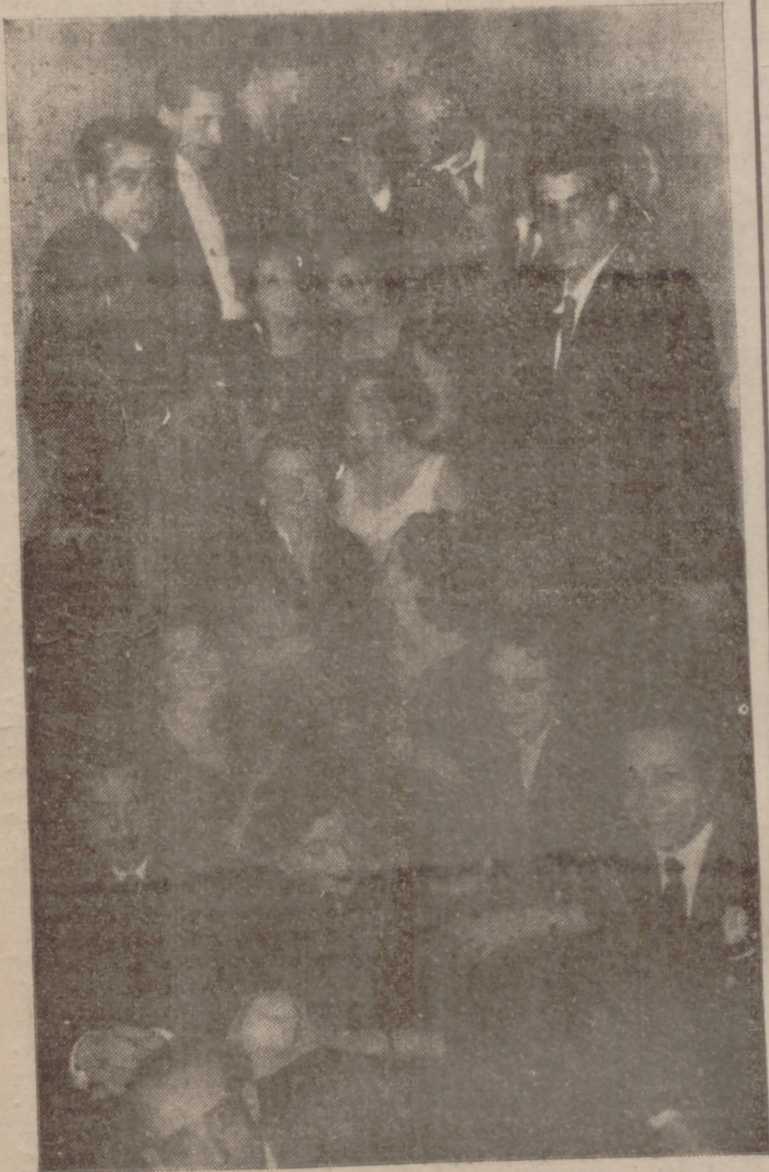
Señores de Román, de Velasco, de Rodrigo, de Gonzalo y de Rodríguez en las fiestas de fin de año en el Aero Club.