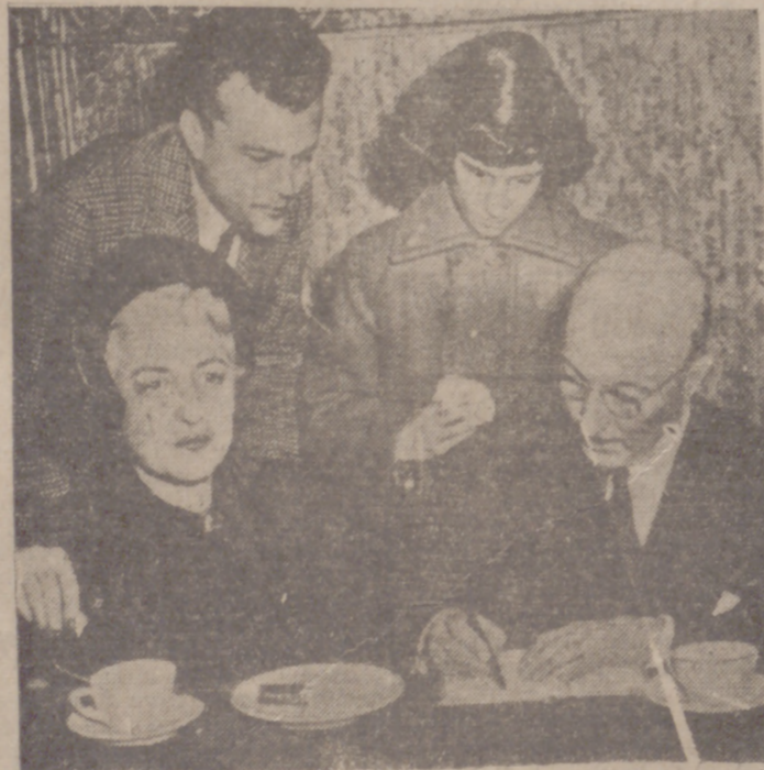
Los embajadores Zellenbach, fotografiados con sus hijos.

Están valoradas en millón y medio de pesetas