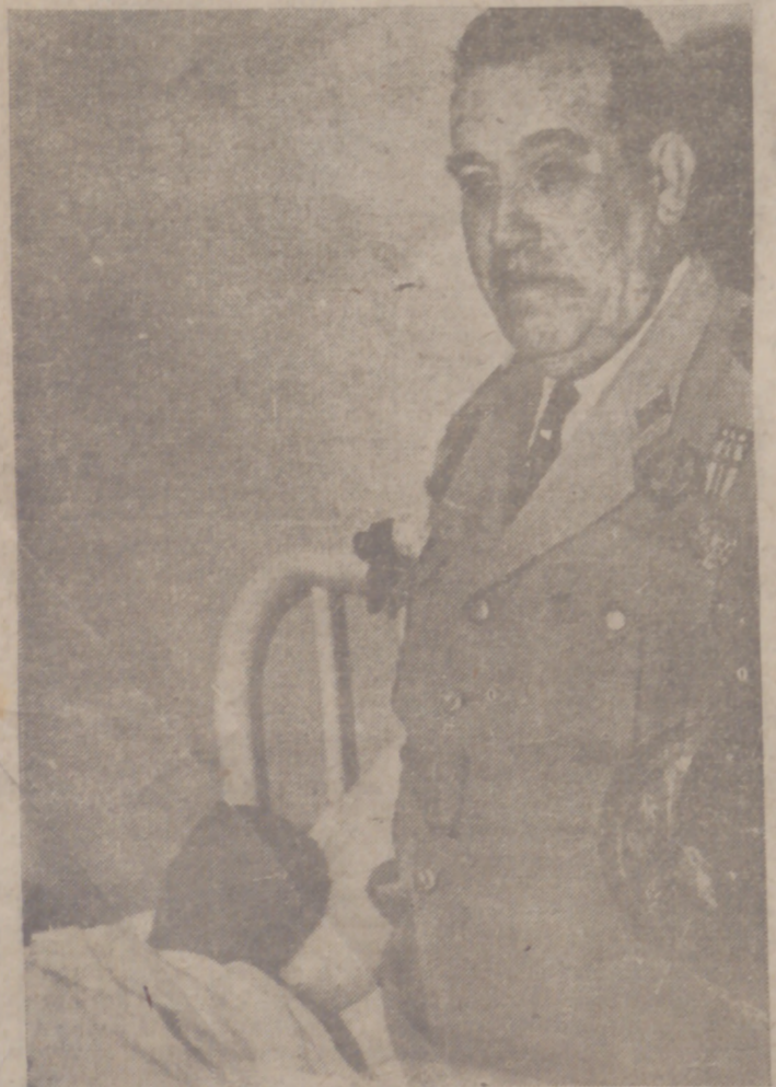
El general Zamalloa visita a uno de los heridos.