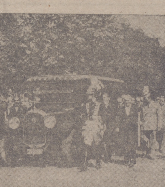
MADRID.—Un aspecto de la comitiva fúnebre a su paso por la Castellana. En primer término, el clero con cruz alzada y la carroza fúnebre rodeada de ujieres de las Cortes Españolas y del Ayuntamiento; una sección de la Guardia Municipal y ordenanzas de distintos centros artísticos a los que pertenecía el finado.