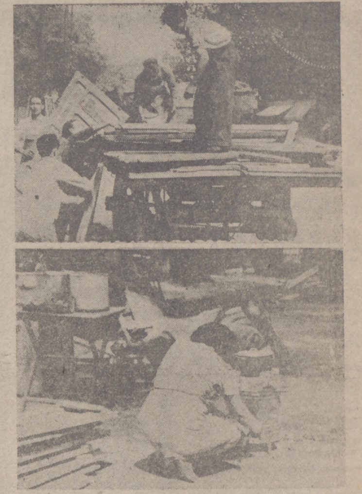
De la feria, todos hablan según les va en ella. Pregúntense y uno por uno darán la versión que se acomode. Mas entretanto, refiriéndonos a la que ya se está echando encima, podemos "a priori" decir algo, aunque sólo sea refiriéndonos a una gran parte del público que la aguarda y cuenta las horas que faltan, ya muy pocas.

Pontevedra, 14.—Esta mañana, por carretera, emprendió el viaje de regreso a Madrid el ministro de la Gobernación, don Blas Pérez González.—Cifra.