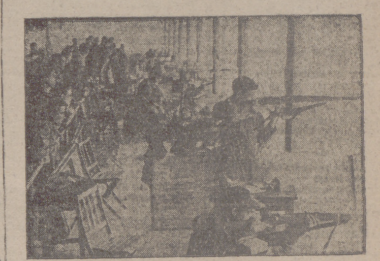
Un momento de la prueba

EL SEÑOR ANDOIN BATIÓ EL RECORD DE ESPAÑA DE TIRO DE FUSIL