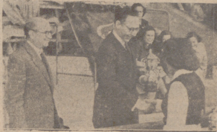
En el festival universitario de Educación Física, celebrado en el Estadio, destacó la nota humorística expuesta en la exhibición de gimnasia con arreglo a los cánones de 1900. Ahí los tienen ustedes, con pantalones al uso, artística camiseta rayada, faja y, para que nada faltara, los fierros mostachos. Si, señor: así se hacía gimnasia en 1900. Todos nos reímos mucho, excepto algún abuelo, al que se le fueron cincuenta años de encima. En la foto inferior, el excelentísimo señor Gobernador civil entregando la Copa de Gimnasia y Bailes Populares a la madrina de Filosofía y Letras.