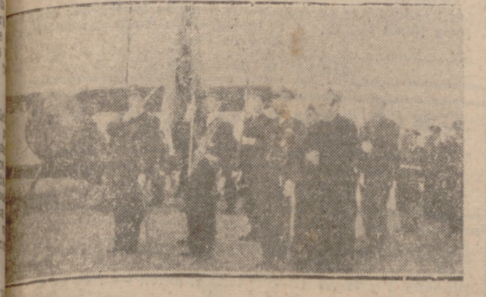
UN MOMENTO DEL SÓLEMNE ACTO CELEBRADO AYER (Información en páginas interiores.)