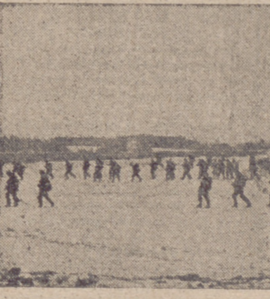
Patrullas ofensivas alemanas en una acción de reconocimiento

Con la intervención nipona, la guerra ha tomado un carácter naval. Después de los éxitos alcanzados en el Pacífico, la reunión de los representantes de los países del Pacto Tripartito parece predecir una ofensiva general en el Atlántico. En ciertos círculos londinenses existe la creencia de que los alemanes no dejarán pasar mucho tiempo sin reanudar la batalla. La personalidad del almirante Raeder es actualmente la clave de estas hipótesis.