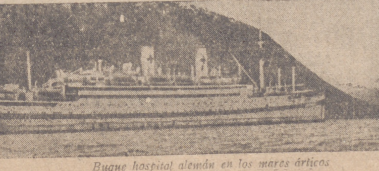
Buque hospital alemán en los mares árticos