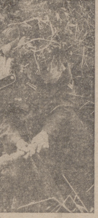
Soldado alemán, en un nido del frente meridional, disponiéndose a lanzar una bomba de mano

Un cañonero y seis torpederos británicos hundidos en las cercanías de Singapur