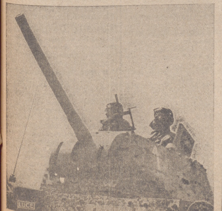
Máquinas italianas en el frente de Tobruk

ren saber de España. Los periódicos son para ellos el lazo que les une a la Patria querida. Sobre su visita al Führer nos ha dicho: "Fui recibido por el Führer a las dos y media de la tarde y me invitó a almorzar en su compañía. Estuvimos cuatro horas largas, en el transcurso de las cuales mostré diferentes planos tratando de los problemas generales del frente, así como del sector donde se hallan nuestros soldados. Transmití al Führer el saludo de nuestro Caudillo. Hitler hablome de nuestro jefe de Estado con gran cariño, como si fuera uno de sus mejores amigos, dedicando a su persona extraordinarios elogios, señalándome en el curso de esta conversación el afecto y estima que le profesa. Hitler preguntó cosas de España. Se entrevistó también el general Moscardó con el mariscal von Brautheisch, comandante mayor del Ejército alemán; con el mariscal von Keitel, mando supremo, y con cuantos jefes viven en contacto con la División Española de voluntarios. Asimismo se entrevistó con von Faupel, presidente de la Entidad Hispano-germana, con quien cambió impresiones para un mayor estrechamiento de los lazos de amistad que con Alemania nos unen. Celebró también una larga conferencia con el reichsportführer, con quien convino, como delegado nacional de Deportes, la preparación de diferentes com-