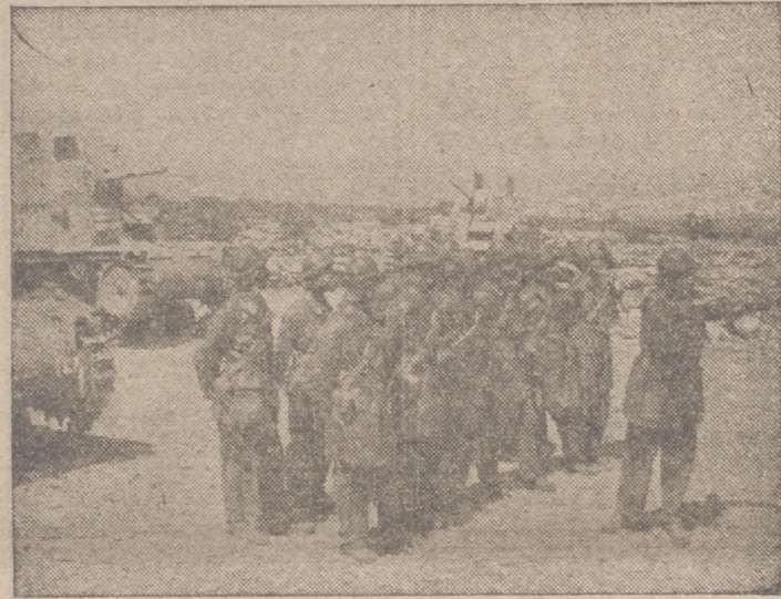
Instrucciones a varios carristas italianos en el frente ruso