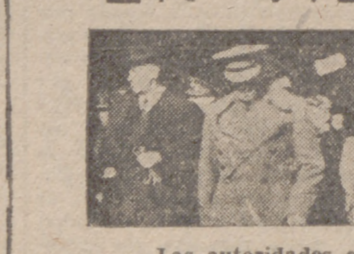
Las autoridades que presidieron el acto