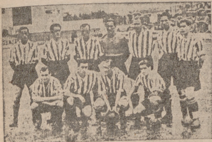
Equipo del Atlético de Bilbao que esta tarde, en San Mamés, jugará un interesante partido con el Real Madrid. Después de sus desafortunados encuentros, los "leones" se sacudirán la melena y es fácil que el Madrid no salga muy bien parado.