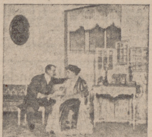
María Guerrero y Fernando Díaz de Mendoza en una de las escenas de "Rosas de Otoño" el día de su estreno, el 13 de abril de 1905

Hagamos patente que ayer se ofreció en Calderón una interpretación sabia, armoniosa y meritoria de "Rosas de Otoño", completada con una adecuada y lujosa presentación en vestuario y decorado. Irene López Heredia y Mariano Asquerino estuvieron sobresalientes en sus papeles. A su lado, Asunción Montijano, Adela Carboné, Rafael Calvo y Federico Górriz, lo mismo que el resto de los intérpretes, hicieron que el éxito fuese total y pleno y que los aplausos sonasen con satisfacción.