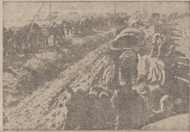
Columnas de avituallamiento siguen a las formaciones rápidas y a la infantería de choque

Washington, 11.—La Cámara de Representantes ha aprobado el proyecto de ley concediendo un nuevo crédito para la realización del programa de "préstamo y arriendo" por 328 votos contra 67. El proyecto ha sido segundamente enviado al Senado.—Efe.