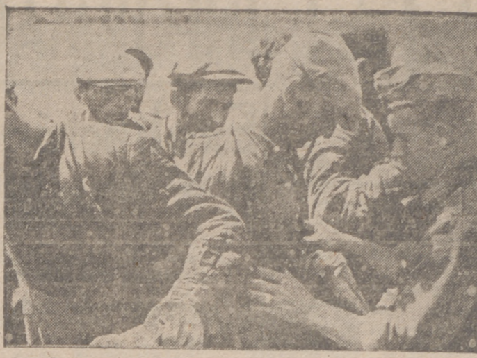
Soldados alemanes registrando a francotiradores soviéticos cogidos en el sector de Kiev

Justicia y Derecho: Resoluciones de la Secretaría General y diversas Jefaturas Provinciales dictadas en