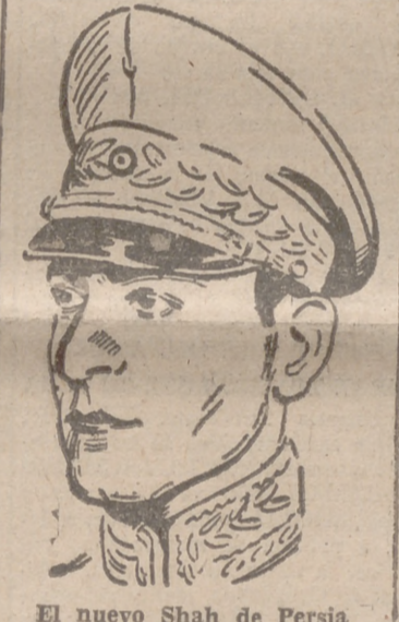
El nuevo Shah de Persia