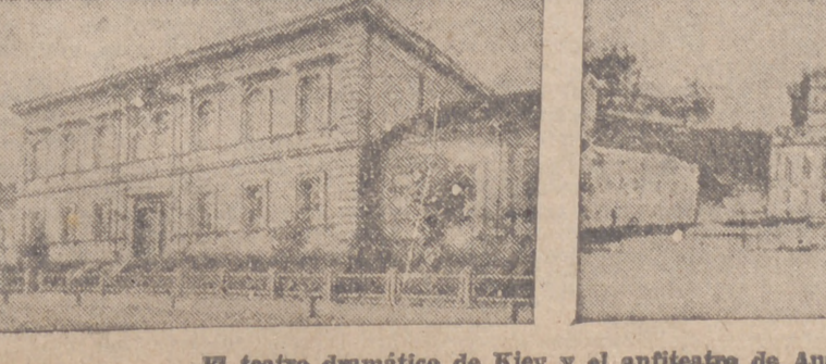
El teatro dramático de Kiev y el antiguo de Anatomía