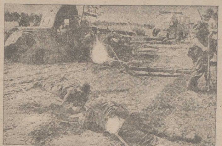
Atención: ¡Peligro de minas! Soldados alemanes limpian una carretera rusa de las minas colocadas por los rojos

Madrid, 10.—La delegada nacional de la Sección Femenina, Pilar Primo de Rivera, se espera que llegará mañana al mediodía.—Cifra.