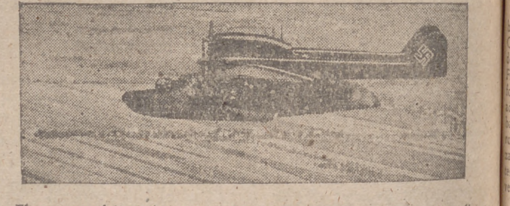
El nuevo modelo de hidroavión alemán para reconocimiento a larga distancia, "Bv 138", dotado de doble fuselaje que le da una velocidad mucho mayor que los demás tipos de reconocimiento.

La lista de figuras eminentes que exhumamos en este artículo pone una mancha negra en la clara sensibilidad del hombre equilibrado. Y nos lleva, afanosos, al paleo que de la filosofía, para hallar una solución satisfactoria a problemas que plantea lo "genial" en su relación (?) con lo patológico. Pero quede la entraña del asunto para los eternos discutidores de la vida. Nosotros nos conformamos con reseñar hechos basados en la ciencia positiva, en lo experimental. El porqué, lo ignoramos. Mas, si sabemos que el problema incita ansiosamente a la inteligencia, y es actual, y es viejo, tan viejo como muchos de los fenómenos del "yo" que aún no hemos podido descubrir cumplidamente. Preferimos que así sea, ya que la esencia del hombre no está en la meta, sino en el camino. No está en la respuesta, sino en la pregunta.