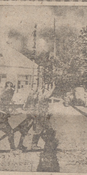
Soldados rojos se entregan en una ciudad conquistada

Company". Se calculan los daños en un millón de dólares, aproximadamente.—Efe.