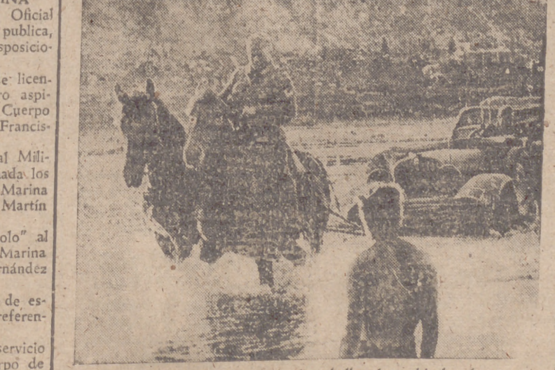
El avance en Rusia.—Con ayuda de caballos, los vehículos de una columna motorizada franquean el río

Según los datos oficiales, desde las cinco de la mañana de lunes hasta las 19 horas cayeron 113 litros de agua por metro cuadrado, y en la noche del lunes al martes se recogieron otros 103 litros por metro cuadrado. Cifra.