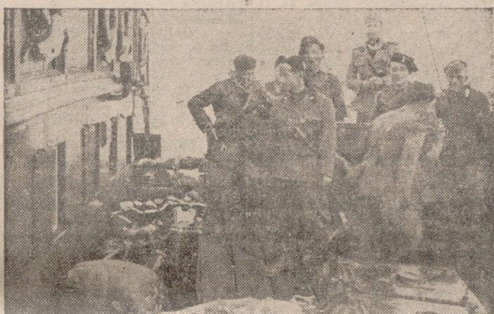
Tropas italianas a bordo

un crucero ligero inglés y dos destructores. Los aparatos de bombardeo en picado han destruido dos barcos mercantes en el puerto de Tobruk y bombardearon los depósitos y baterías antiaéreas. El 30 de junio una potente formación aérea alemana ha bom-